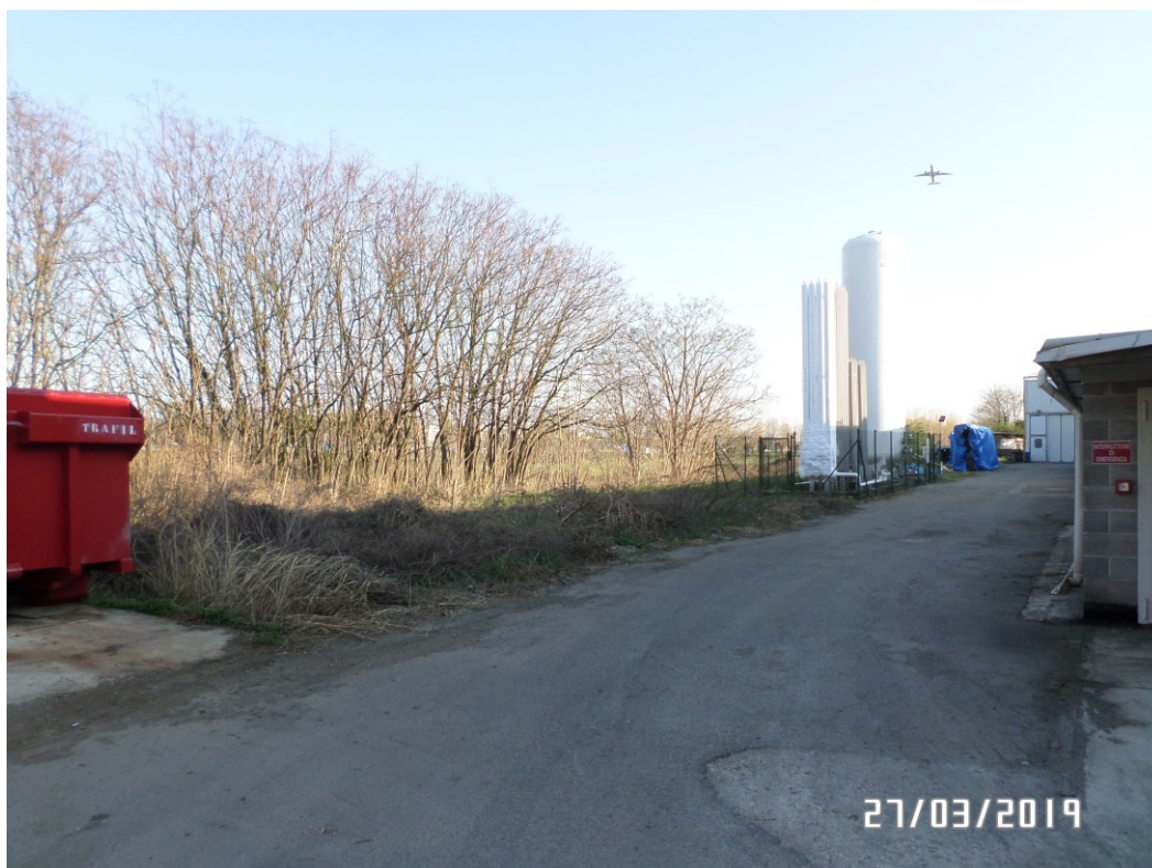
Vista da cortile interno – Vista Nord/Est