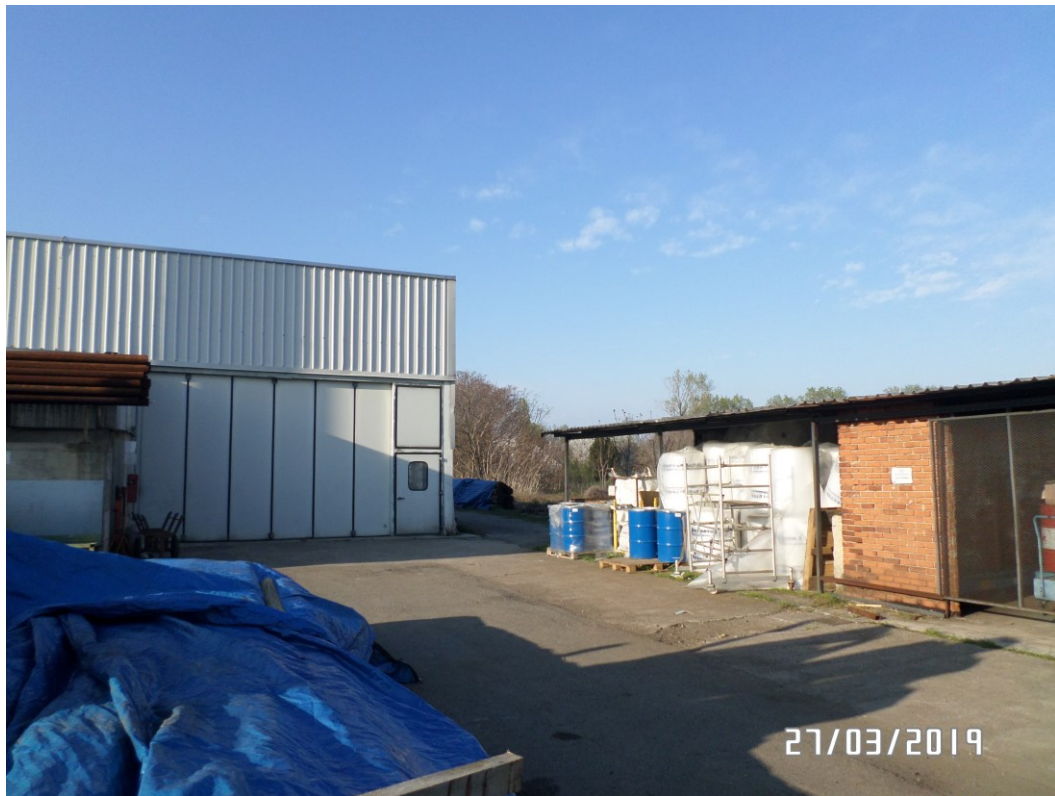
Vista dal cortile retro – Vista Sud/Est