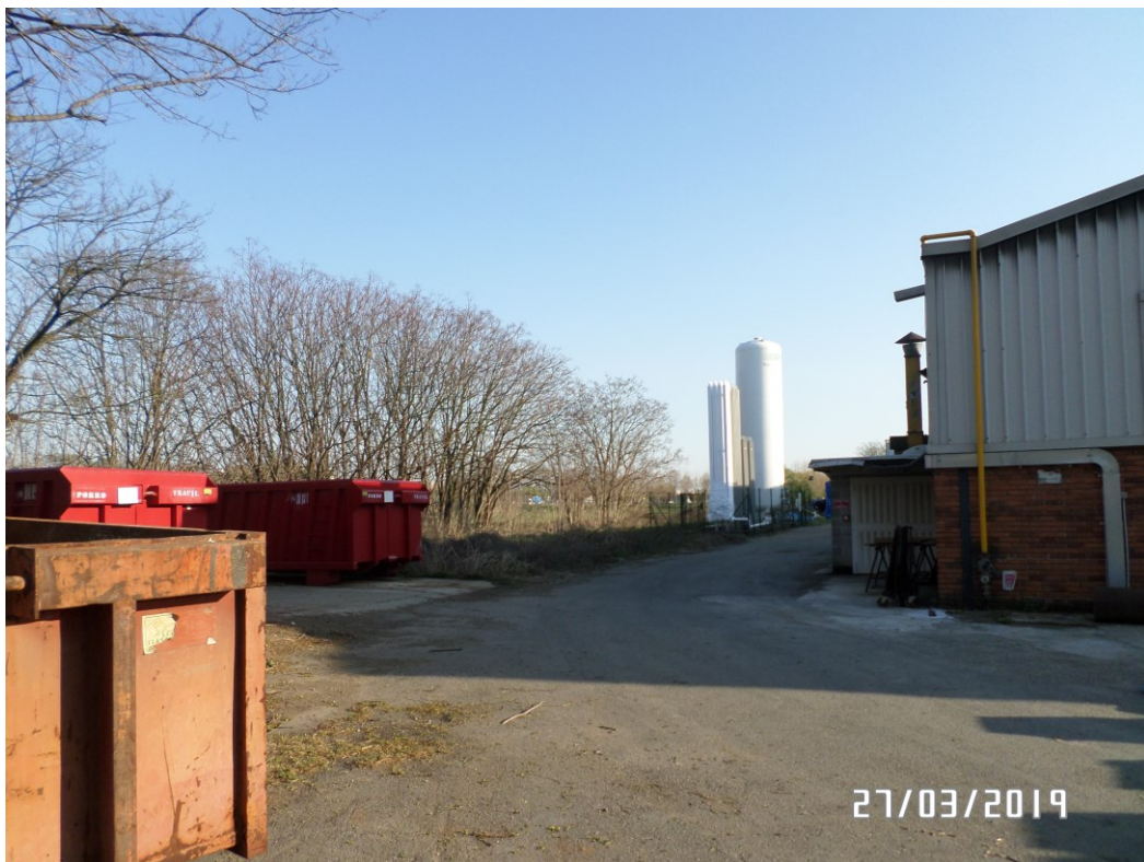
Vista da cortile interno – Vista Nord/Est