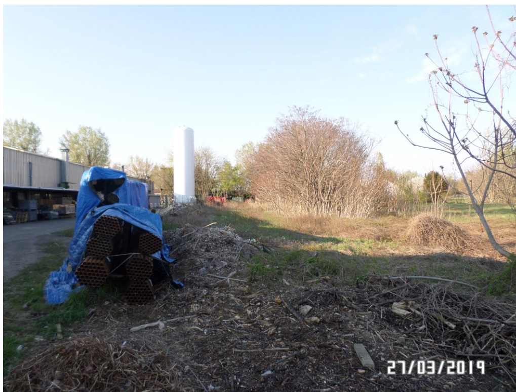
Vista dal prato – Vista Sud/Ovest