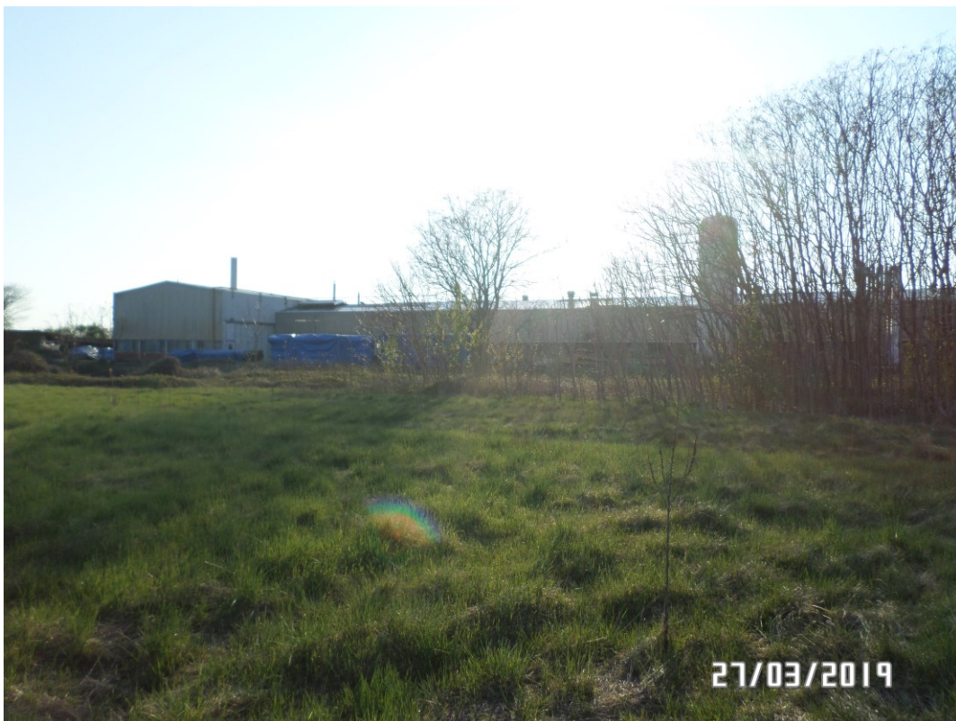
Vista dal prato – Vista Est/Sud