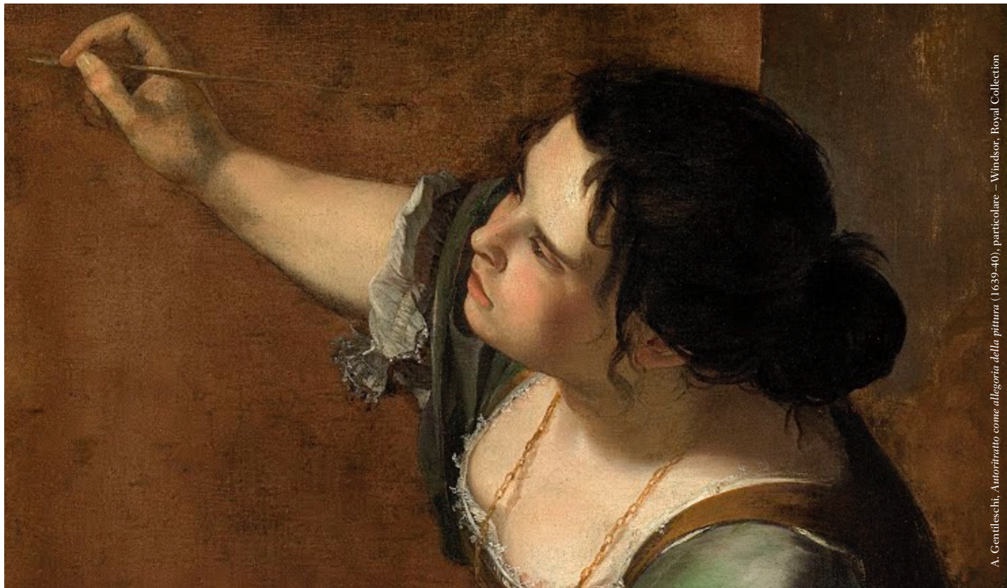
A. Gentileschi, Autoritratto come allegoria della pittura (1639-40), particolare – Windsor, Royal Collection

In occasione della Giornata Internazionale della Donna e per la rassegna Una trama di fili colorati. Conversazioni, spunti e incontri attorno al femminile ieri e oggi (9 a edizione 2021)