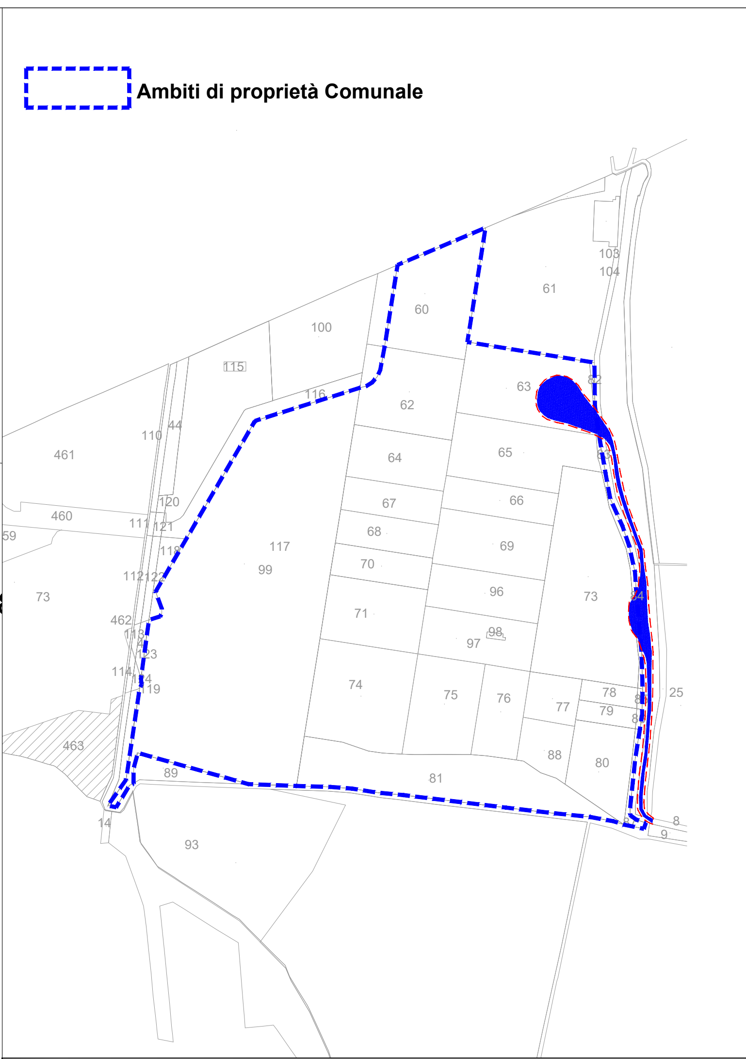
Estratto Piano dei Servizi-Rete Ecologica Comunale Scenario di attuazione