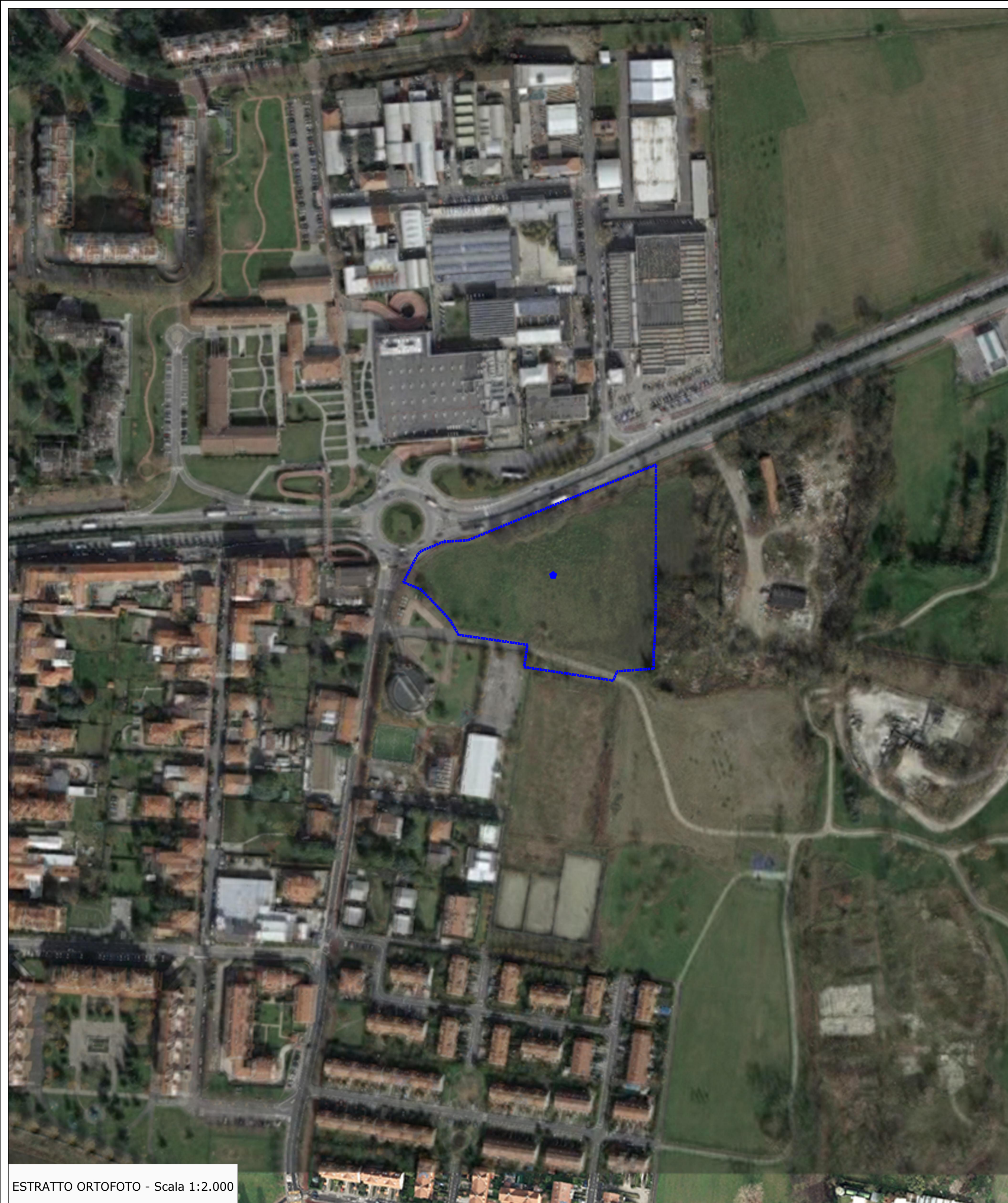
ESTRATTO ORTOFOTO - Scala 1:2.000