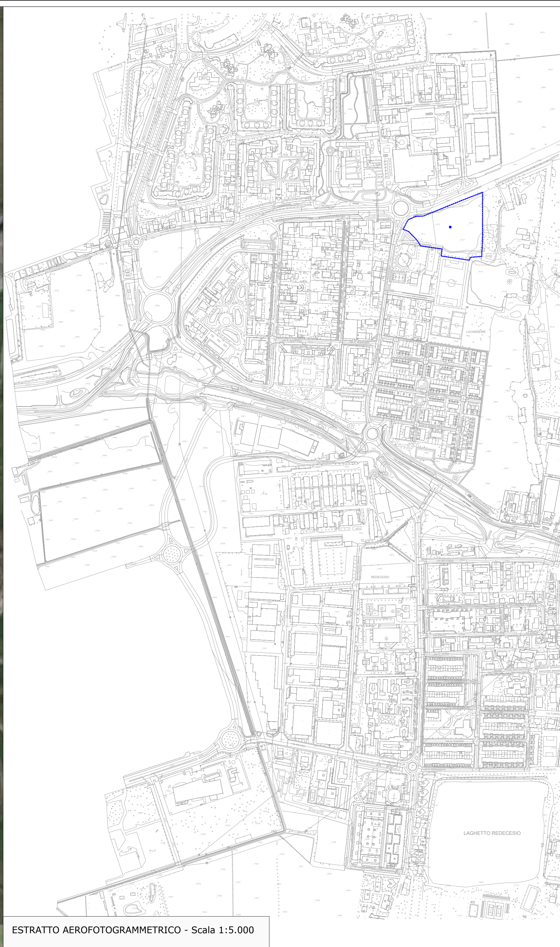
ESTRATTO AEROFOTOGRAMMETRICO - Scala 1:5.000