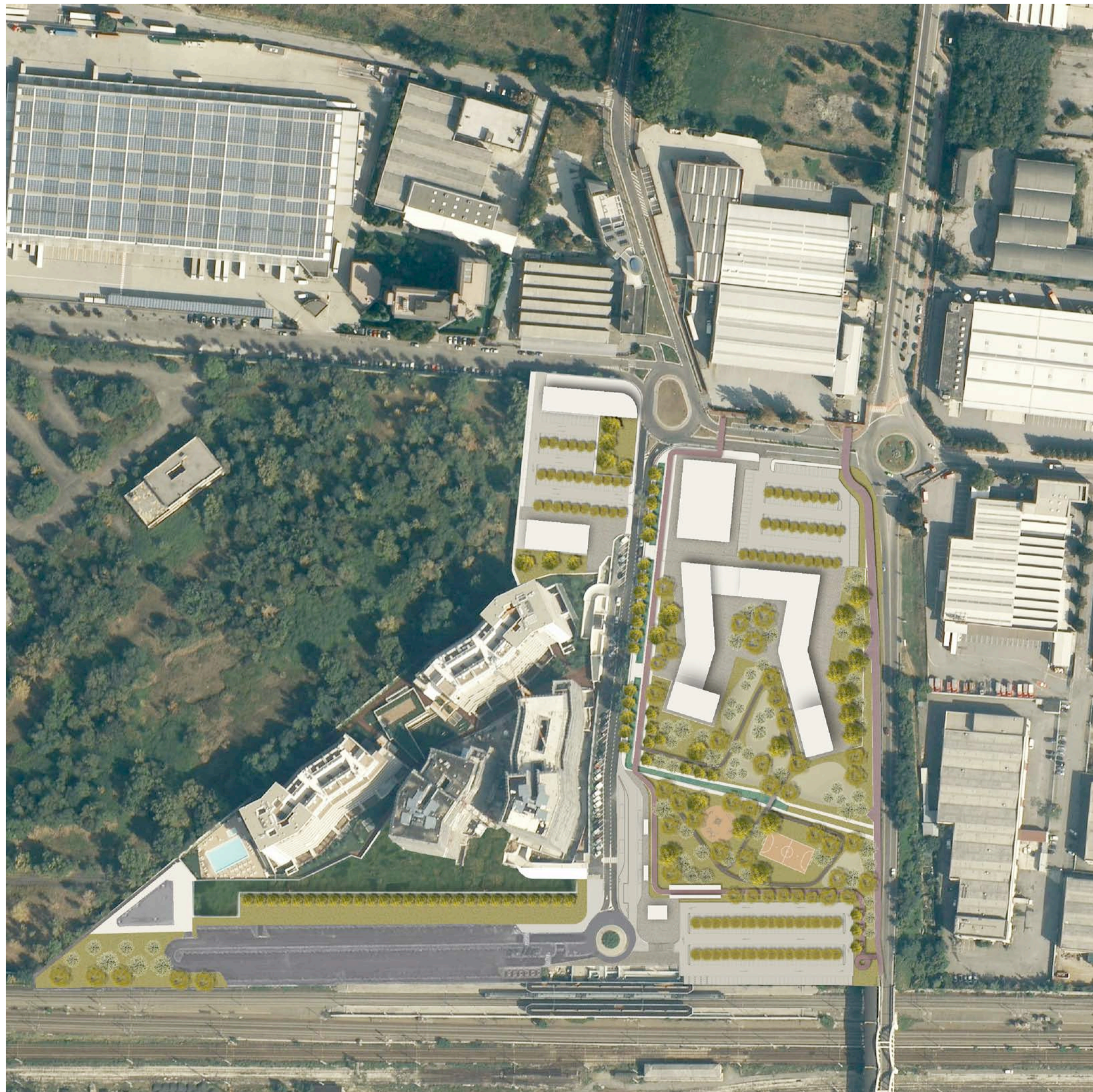
1 PLANIVOLUMETRICO 1:2000