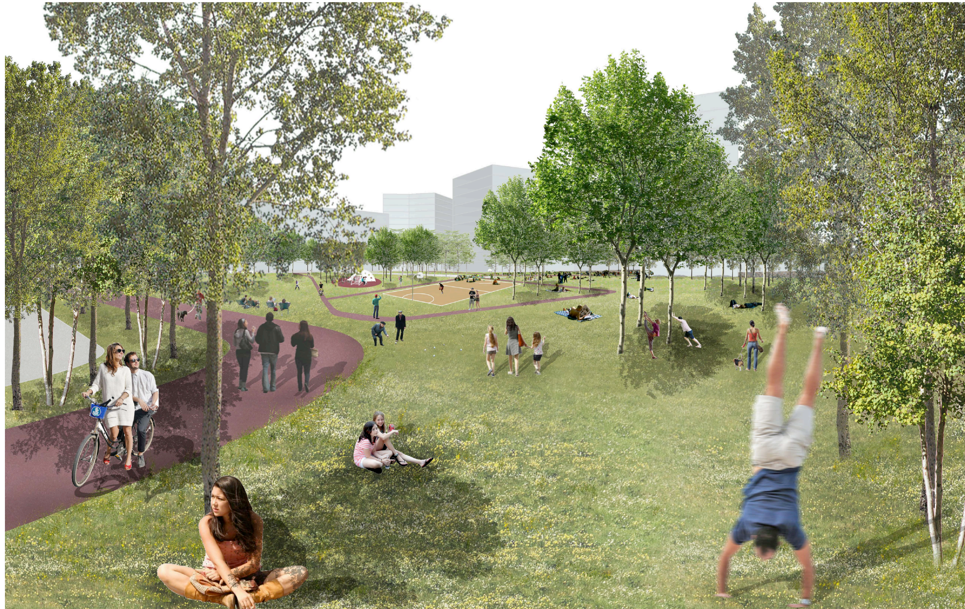
2 VISTA DEL PARCO