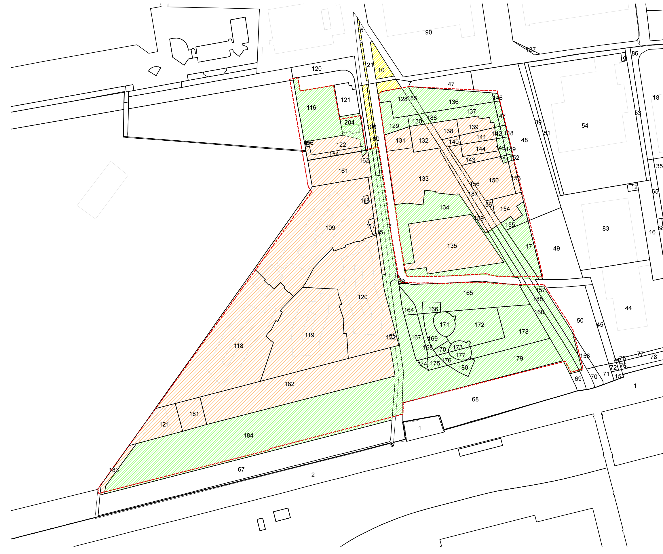
ESTRATTO DI MAPPA CATASTALE CON INDIVIDUAZIONE DELLE PROPRIETA' - Scala 1:2000 STATO VARIANTE PLANIVOLUMETRICA DEL P.II - marzo 2012 - DELIBERA GC n. 49/12