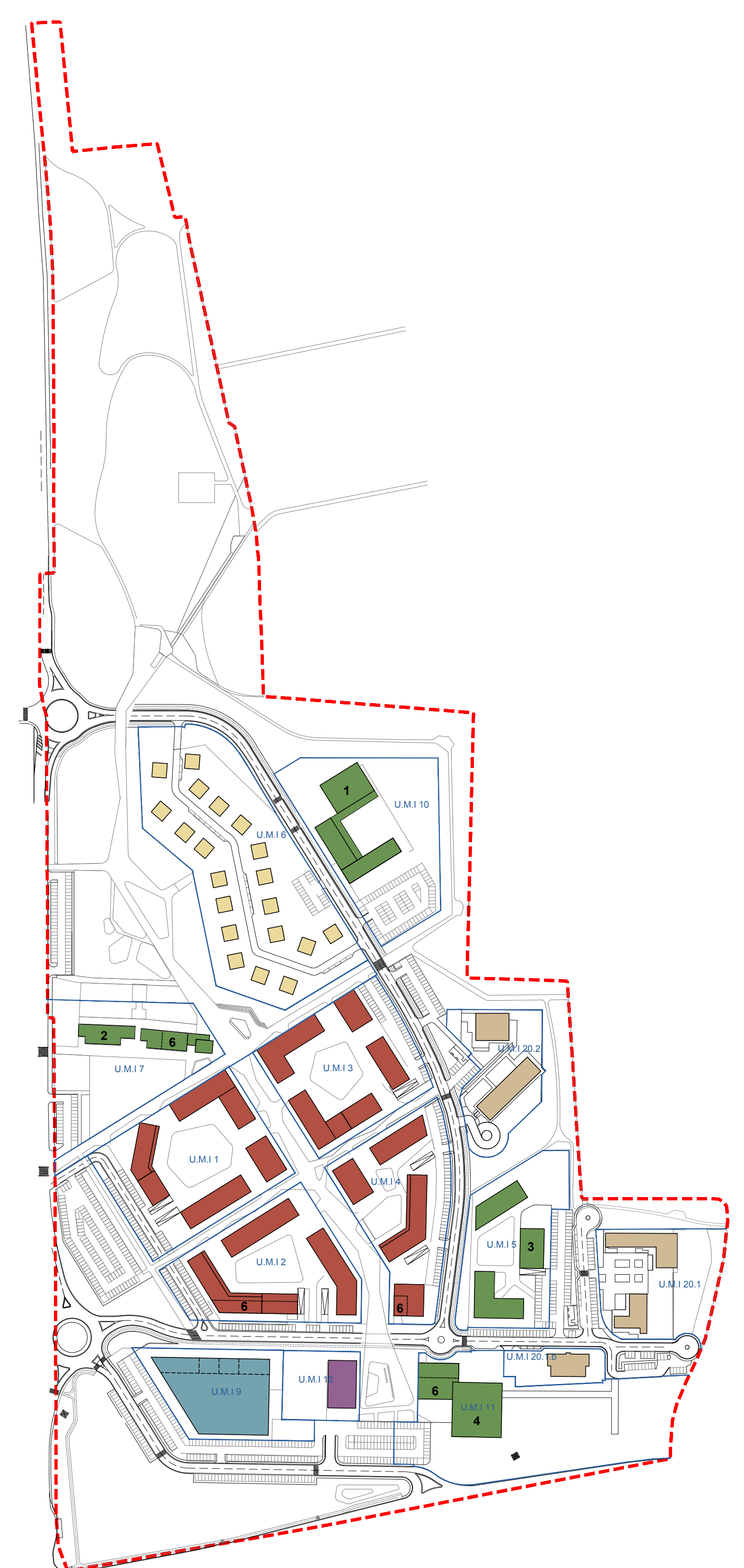
Schema divisione UCP