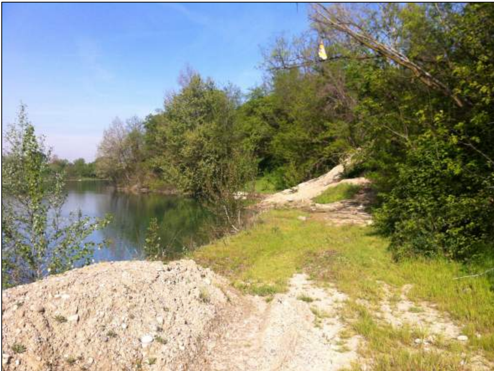
FOTO 30 - VISTA DELLA SPONDA DEL BACINO DI CAVA