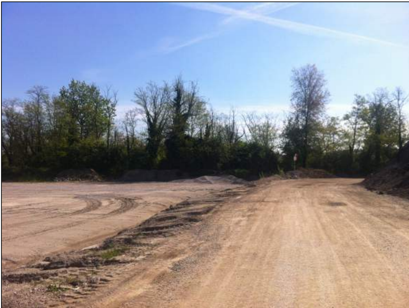
FOTO 19 - VEDUTA DELL'AREA BOSCATO VERSO EST LUNGO IL CONFINE DI PROPRIETA'