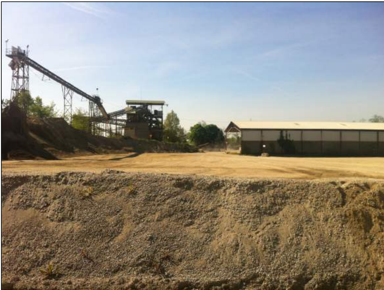
FOTO 21 - VEDUTA DELL'ATTUALE IMPIANTO PRODUTTIVO, VERSO SUD