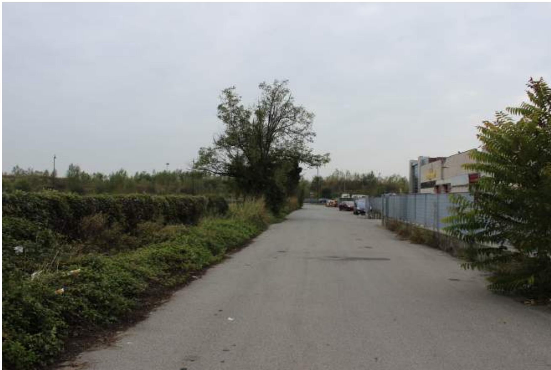
FOTO 42 - VISTA DAL FONDO DI VIA VENEZIA GIULIA VERSO VIA REDECESIO A SUD