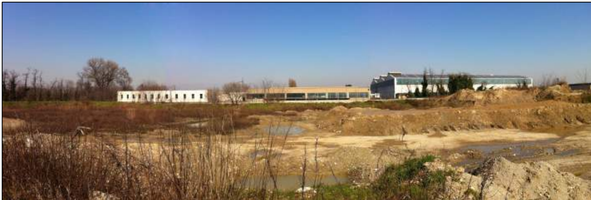
FOTO 22 - VEDUTA DALL'AREA D'INTERVENTO VERSO NORD: SKYLINE DELL'AREA INDUSTRIALE A CONFINE