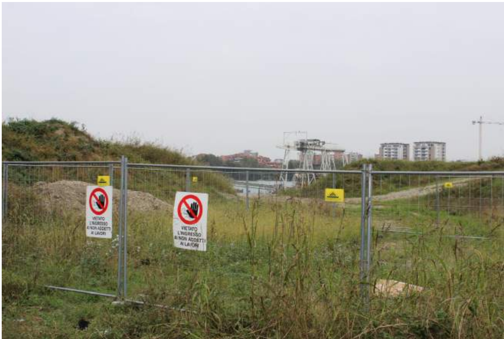
FOTO 41 - VISTA DA VIA VENEZIA GIULIA VERSO L'AREA DI CAVA E IL RELATIVO BACINO D'ACQUA