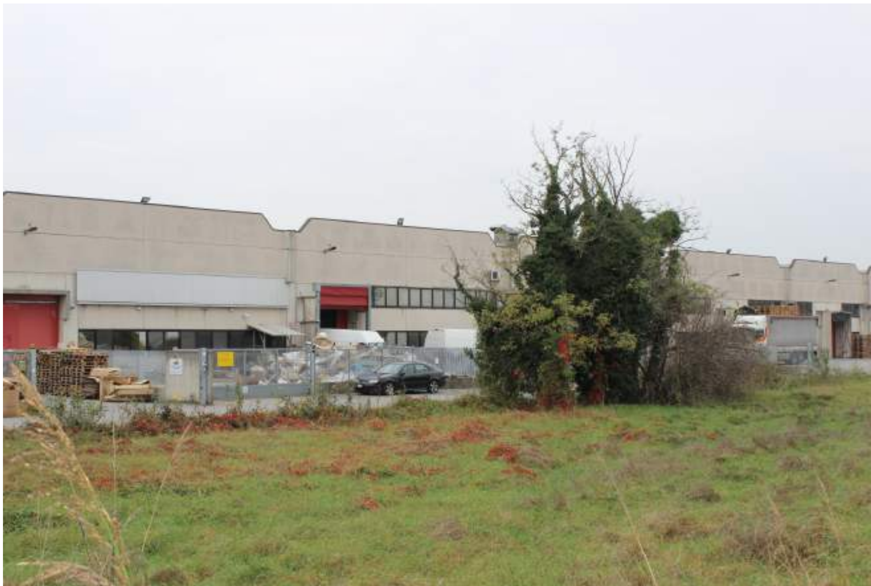
FOTO 38 - VISTA DA VIA REDECESIO VERSO IL COMPLESSO INDUSTRIALE IN VIA VENEZIA GIULIA A NORD OVEST