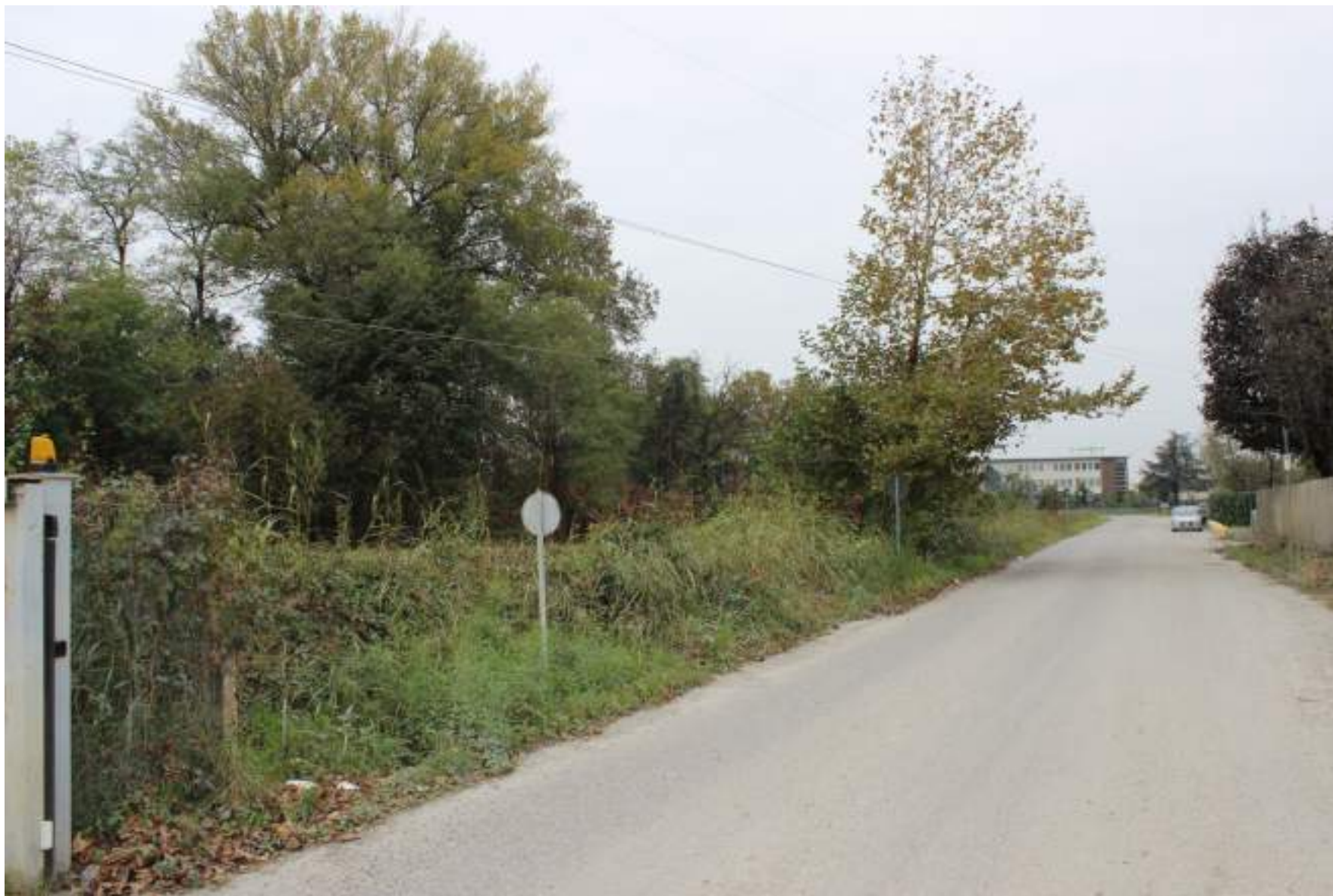
FOTO 6 – VISTA DA VIA CAVA TROMBETTA VERSO VIA CASSANESE E L'AREA BOSCATO A OVEST