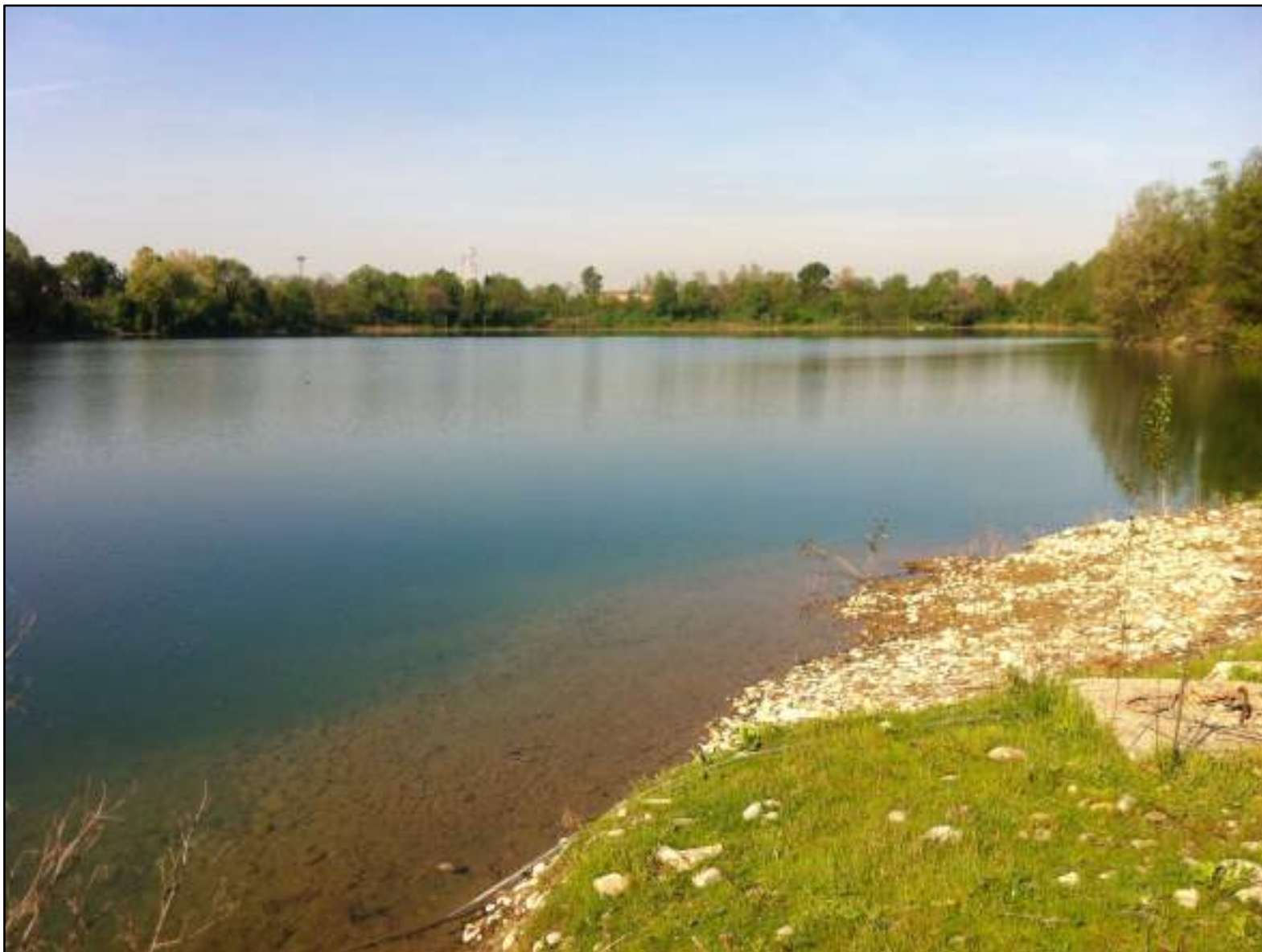
FOTO 31 - VISTA DELLA SPONDA DEL BACINO DI CAVA