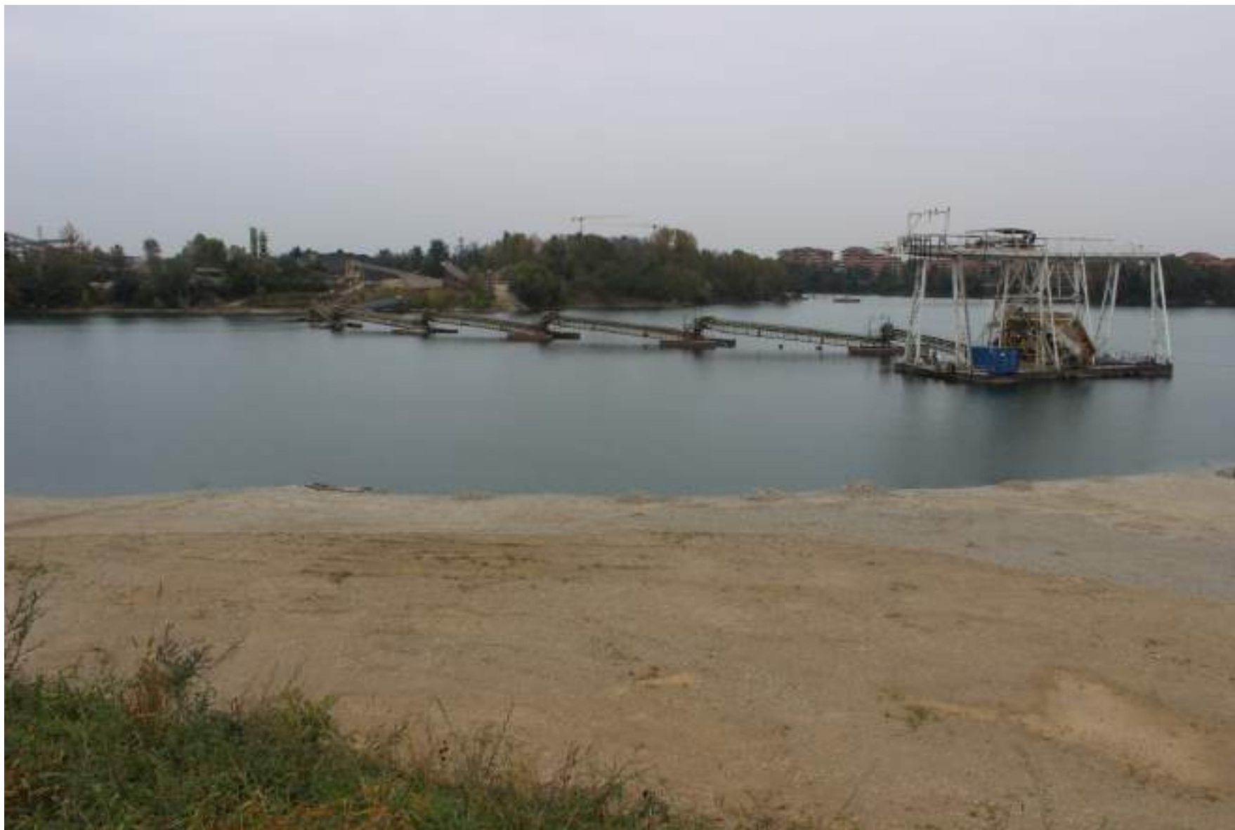
FOTO 44 - VISTA DALLA RIVA DEL BACINO D'ACQUA DELLA CAVA VERSO L'AREA DI INTERVENTO A NORD