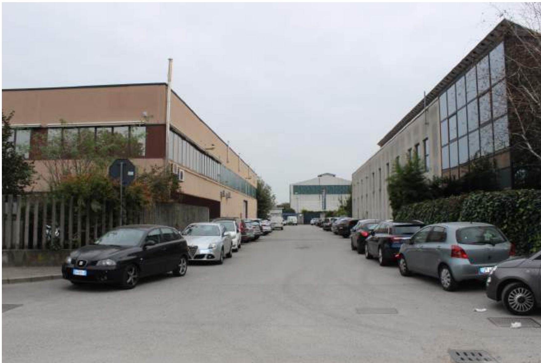
FOTO 4 – VISTA DA VIA CAVA TROMBETTA VERSO IL COMPLESSO INDUSTRIALE A EST