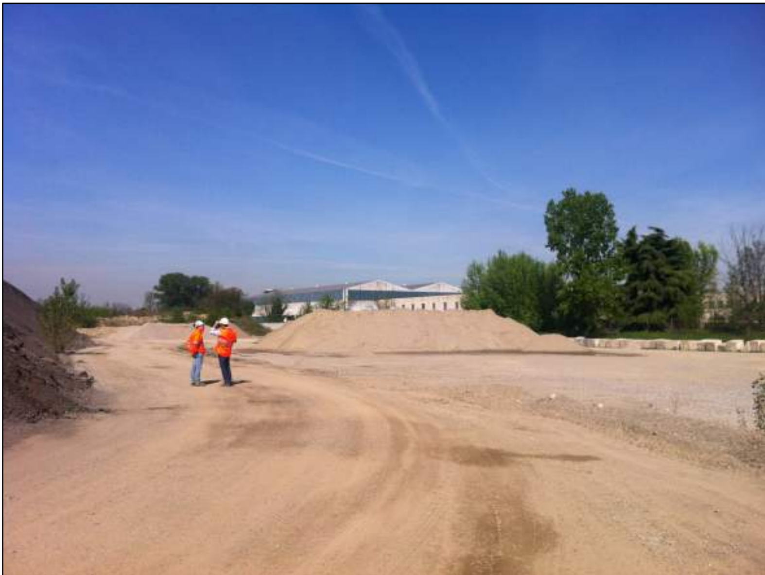
FOTO 16 - VEDUTA DALL'AREA D'INTERVENTO, VERSO NORD OVEST