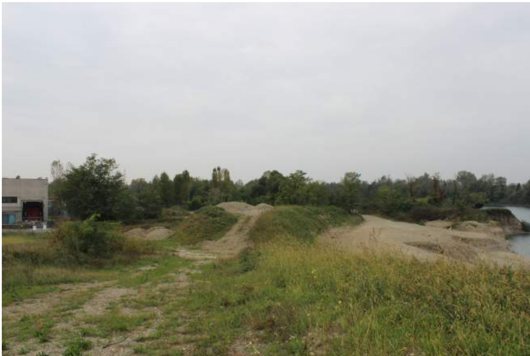
FOTO 47 - VISTA DALLA RIVA DEL BACINO D'ACQUA DELLA CAVA VERSO OVEST