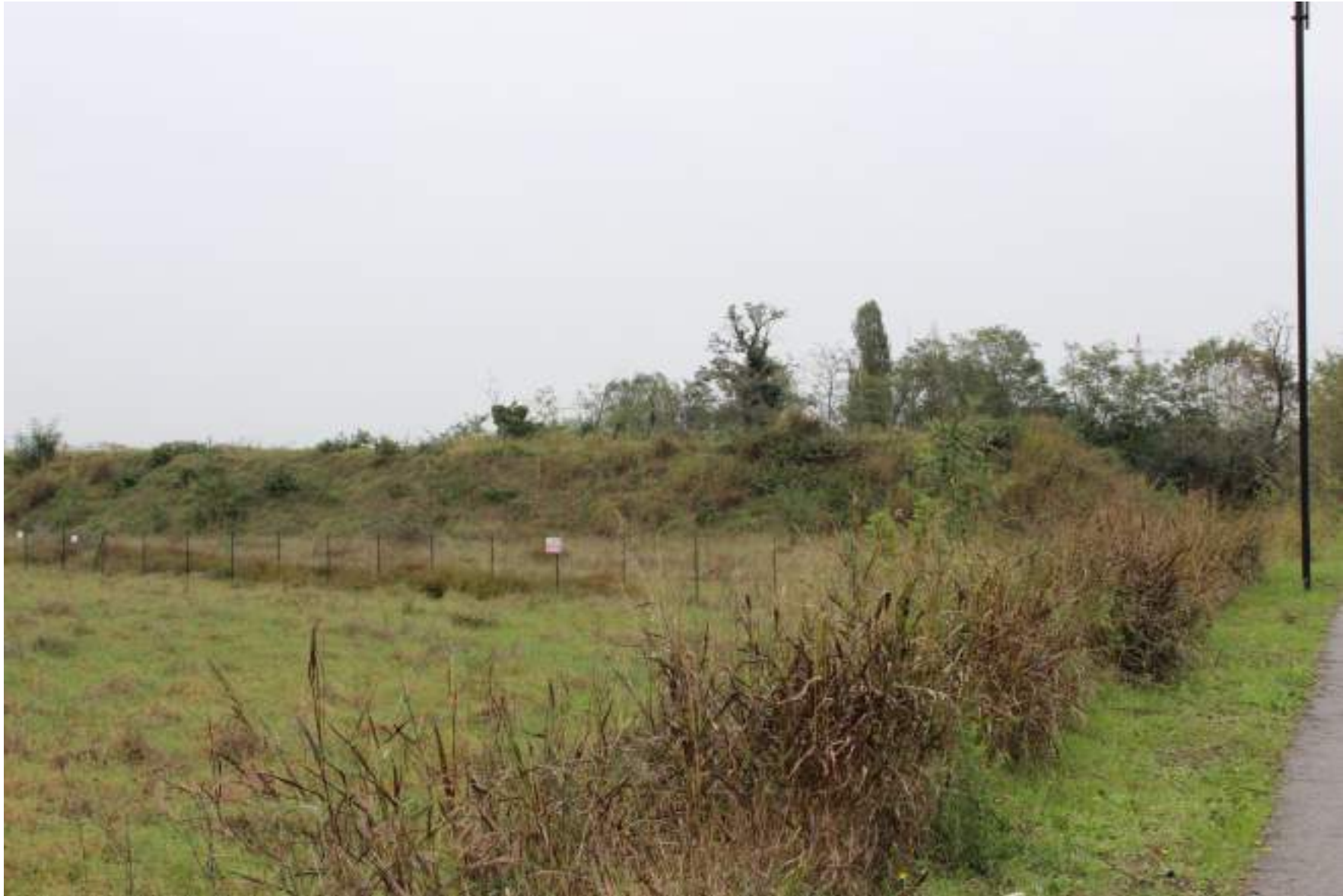
FOTO 35 - VISTA DA VIA REDECESIO VERSO L'AREA VERDE A NORD EST