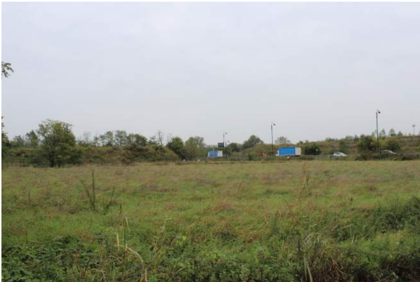
FOTO 40 - VISTA DA VIA VENEZIA GIULIA VERSO VIA REDECESIO