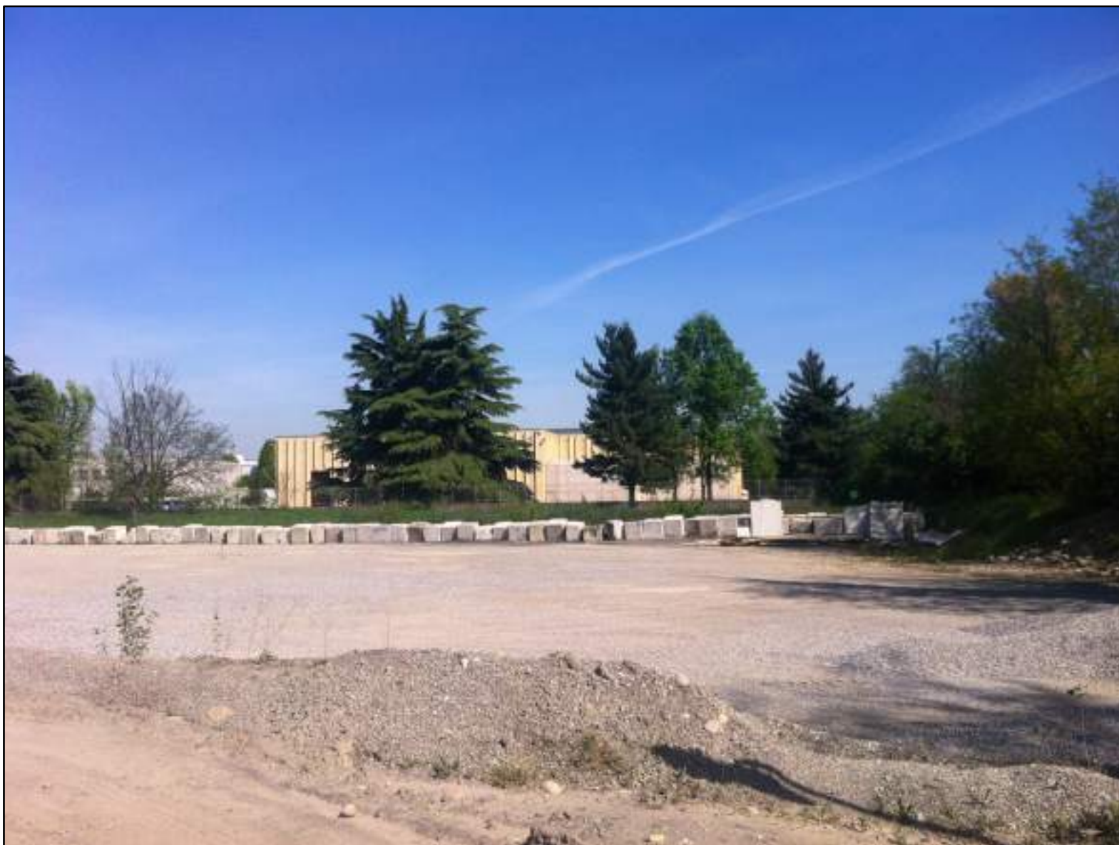
FOTO 18 - VEDUTA VERSO EST DELL' AREA BOSCATO A RIDOSSO DEL CONFINE DI PROPRIETA'