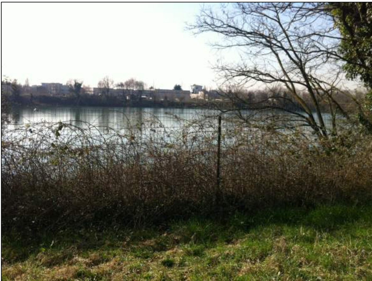
FOTO 29 - VISTA VERSO SUD DEL BACINO DI CAVA, VERSO L'AREA INDUSTRIALE