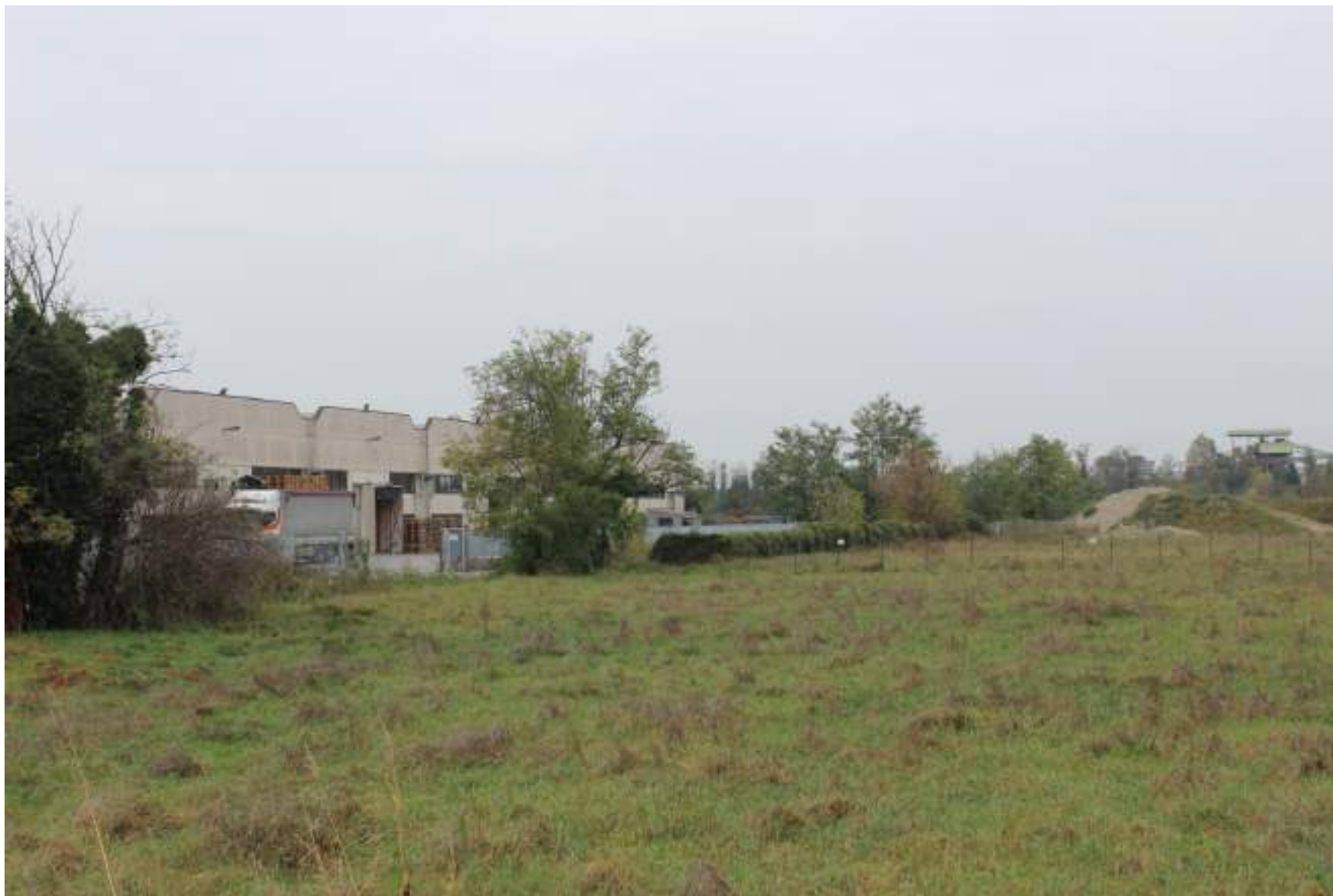
FOTO 36 - VISTA DA VIA REDECESIO VERSO IL COMPLESSO INDUSTRIALE IN VIA VENEZIA GIULIA A NORD OVEST