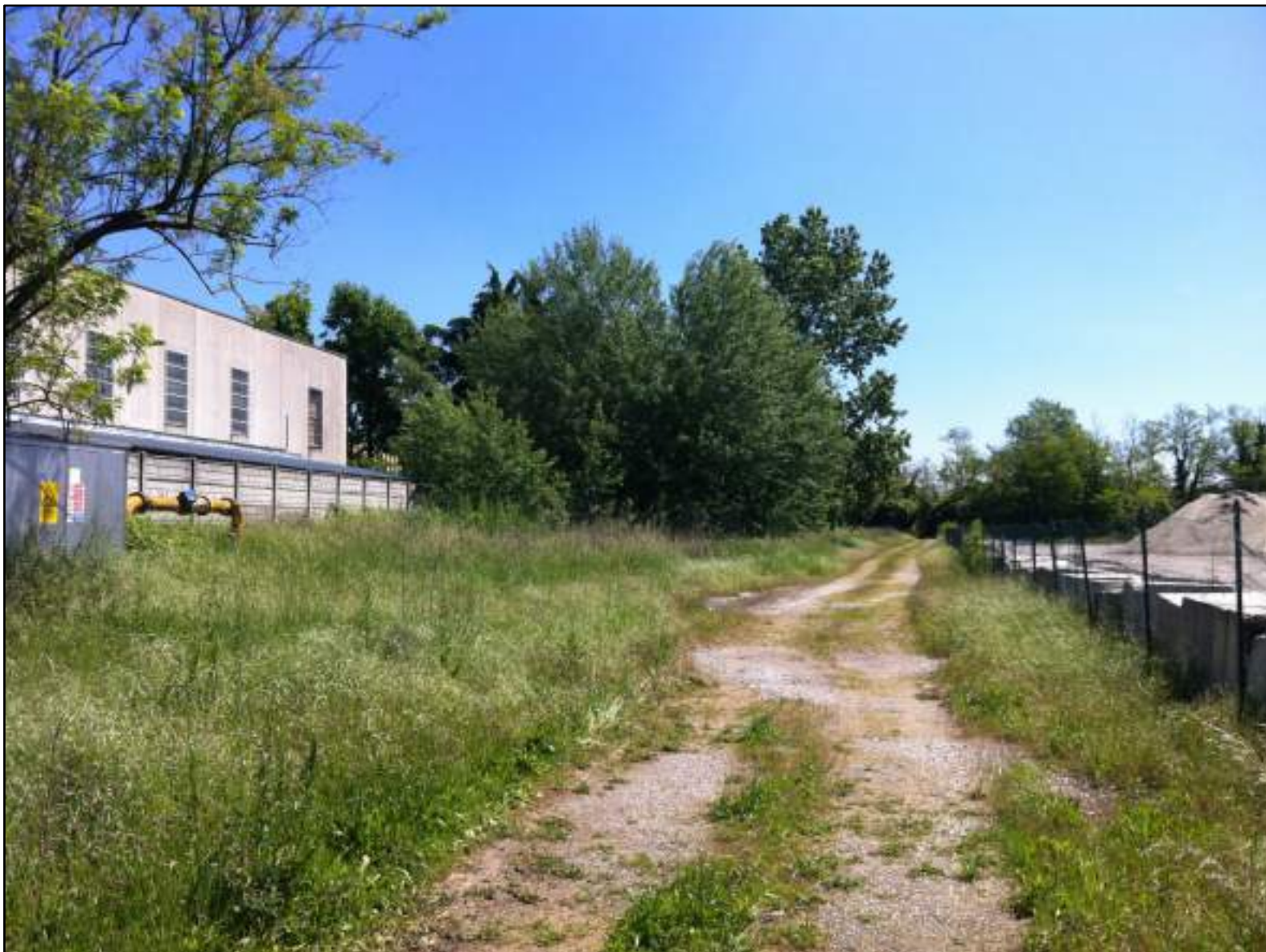
FOTO 14 - VEDUTA DELL'AREA BOSCATI VERSO EST