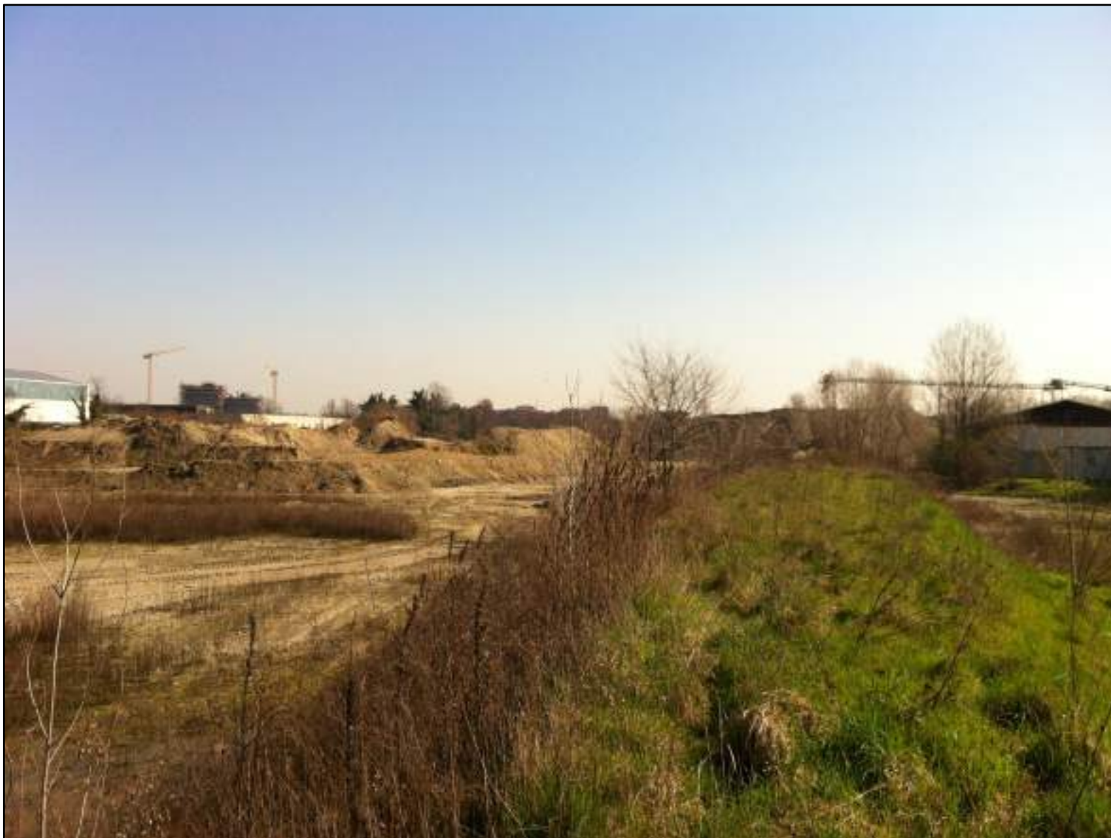
FOTO 25 - VEDUTA DALL'AREA D'INTERVENTO VERSO EST : SKYLINE AREA RESIDENZIALE DI SEGRATE CENTRO