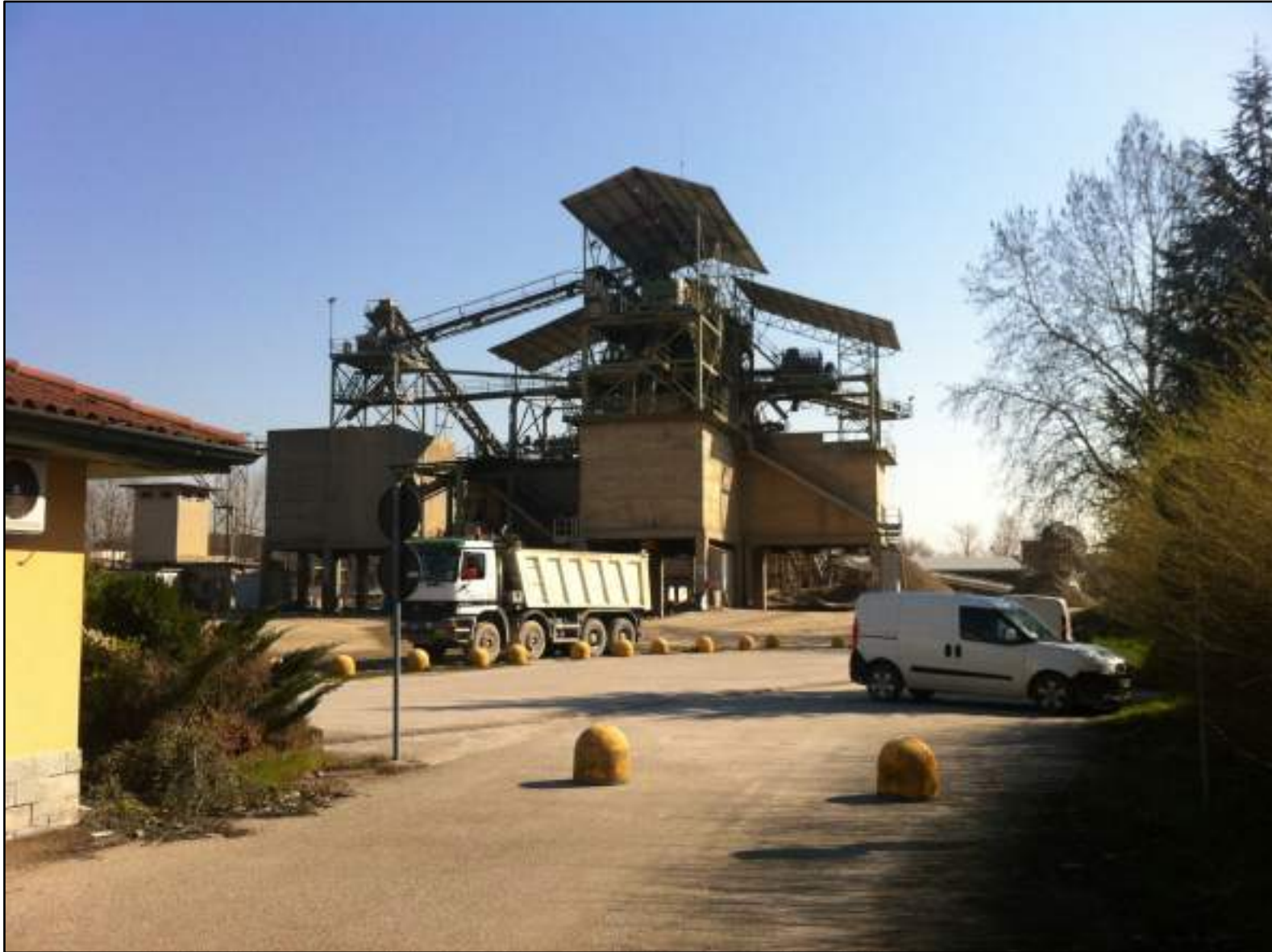
FOTO 28 - VEDUTA DELL'ATTUALE IMPIANTO PRODUTTIVO, VERSO EST