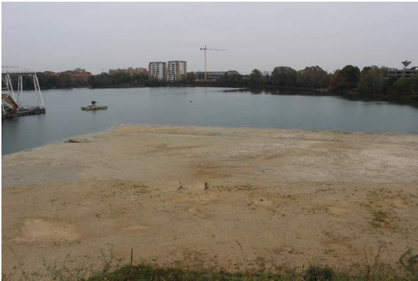
FOTO 45 - VISTA DALLA RIVA DEL BACINO D'ACQUA DELLA CAVA VERSO NORD EST