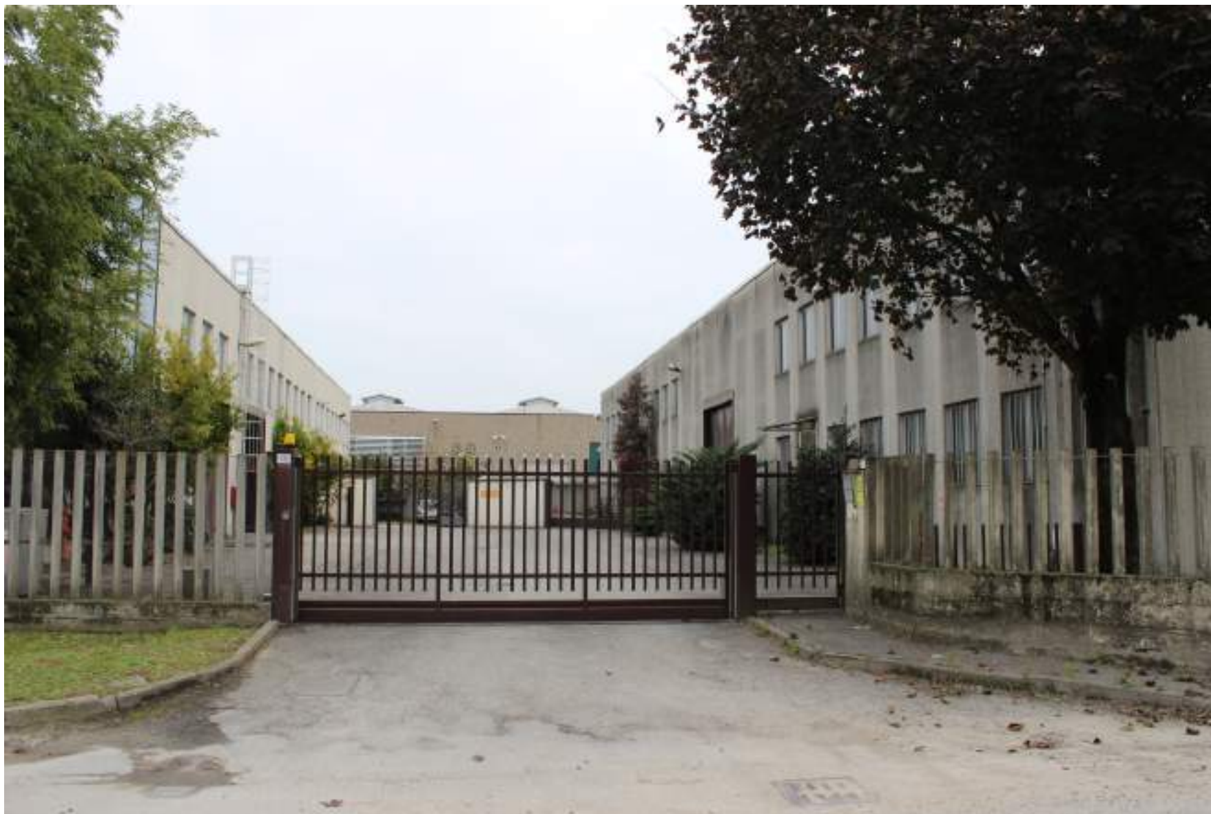
FOTO 5 – VISTA DA VIA CAVA TROMBETTA VERSO IL COMPLESSO INDUSTRIALE A EST