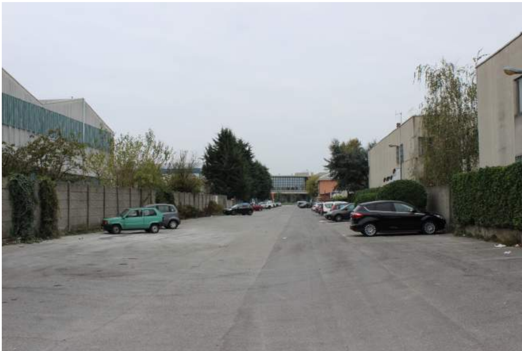
FOTO 10 – VISTA DA VIA LEONARDO DA VINCI VERSO VIA CASSANESE A NORD