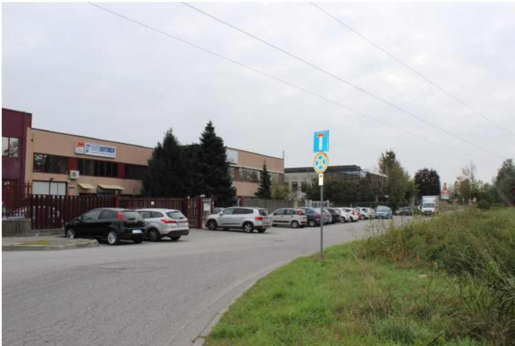
FOTO 2 - VISTA VERSO LA VIA CAVA TROMBETTA