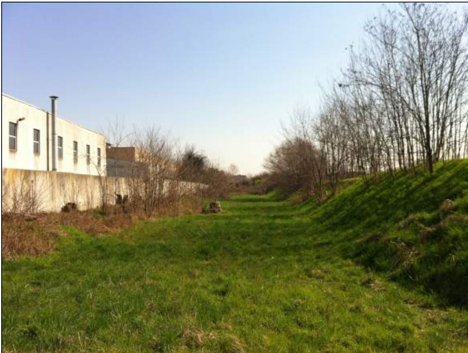
FOTO 12 - VEDUTA DA VIA CAVA TROMBETTA VERSO EST: AREA INDUSTRIALE A CONFINE CON L'AREA D'INTERVENTO