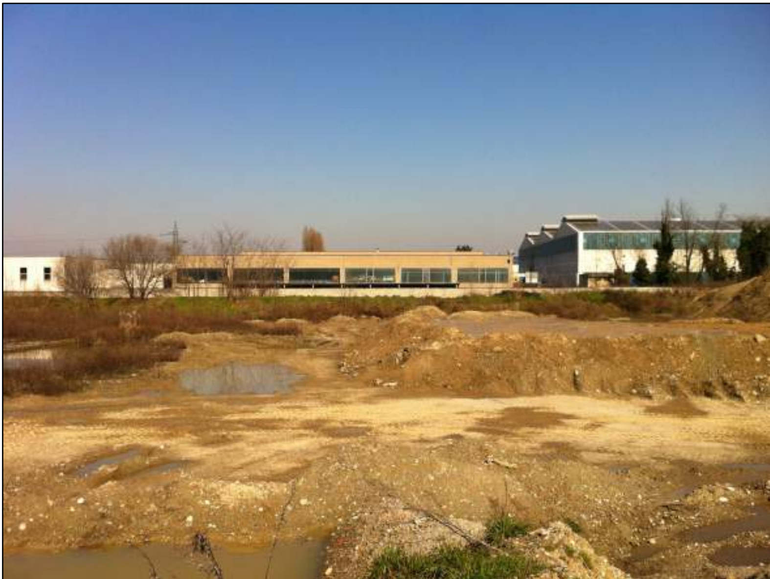
FOTO 23 - VEDUTA DALL'AREA D'INTERVENTO VERSO NORD: AREA INDUSTRIALE A CONFINE