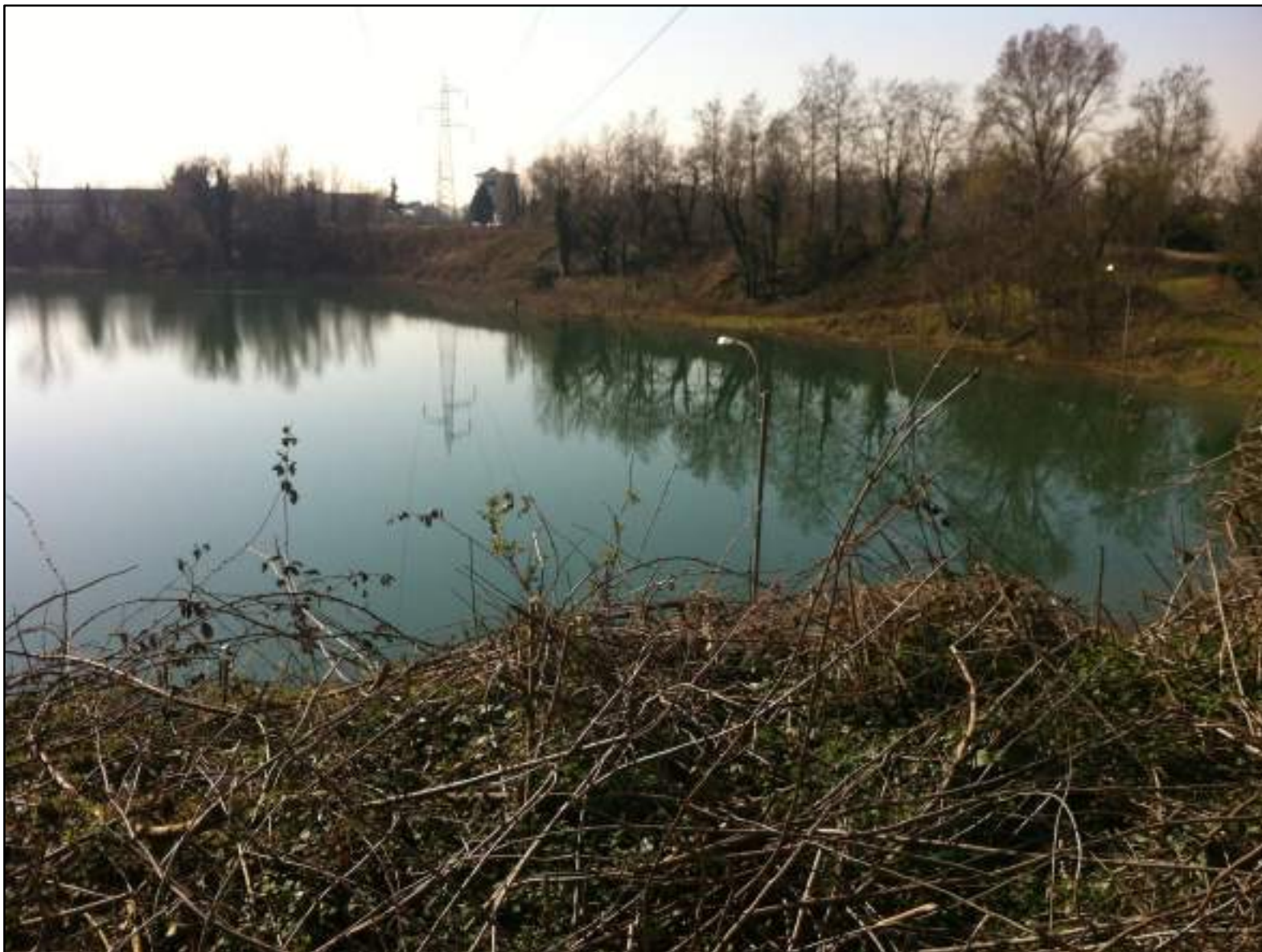
FOTO 52 - VISTA DELLA SPONDA DEL BACINO DI CAVA A OVEST, PASSAGGIO DELL'ELETTRODOTTO