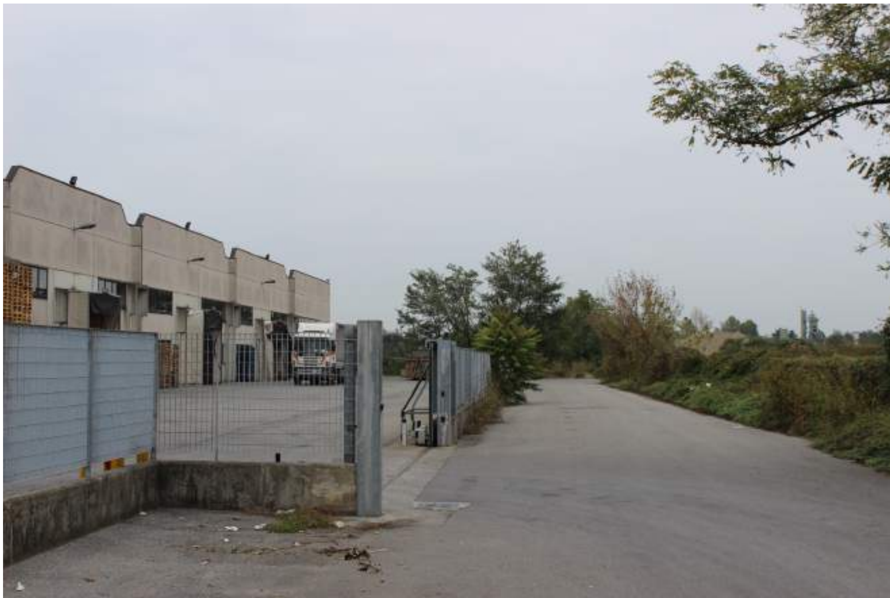
FOTO 39 - VISTA DA VIA VENEZIA GIULIA VERSO NORD