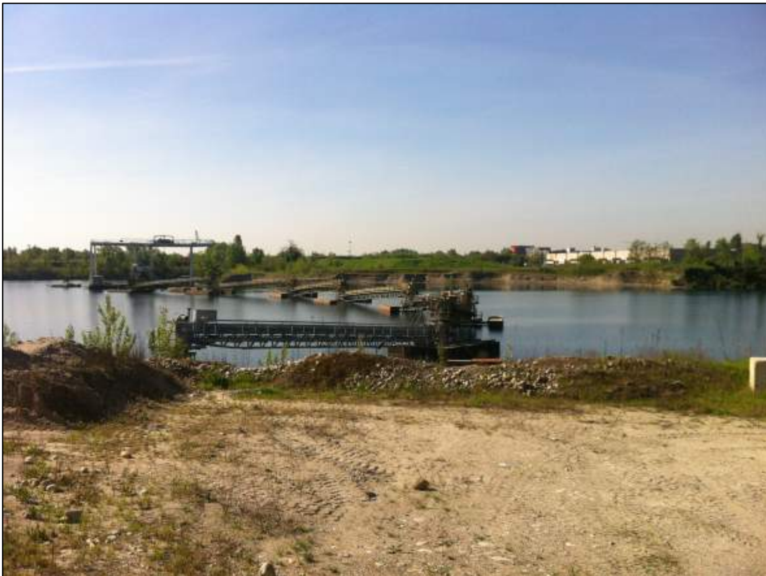
FOTO 33 - VISTA DELLA SPONDA DEL BACINO DI CAVA, VERSO L'AREA D'INTERVENTO A SUD