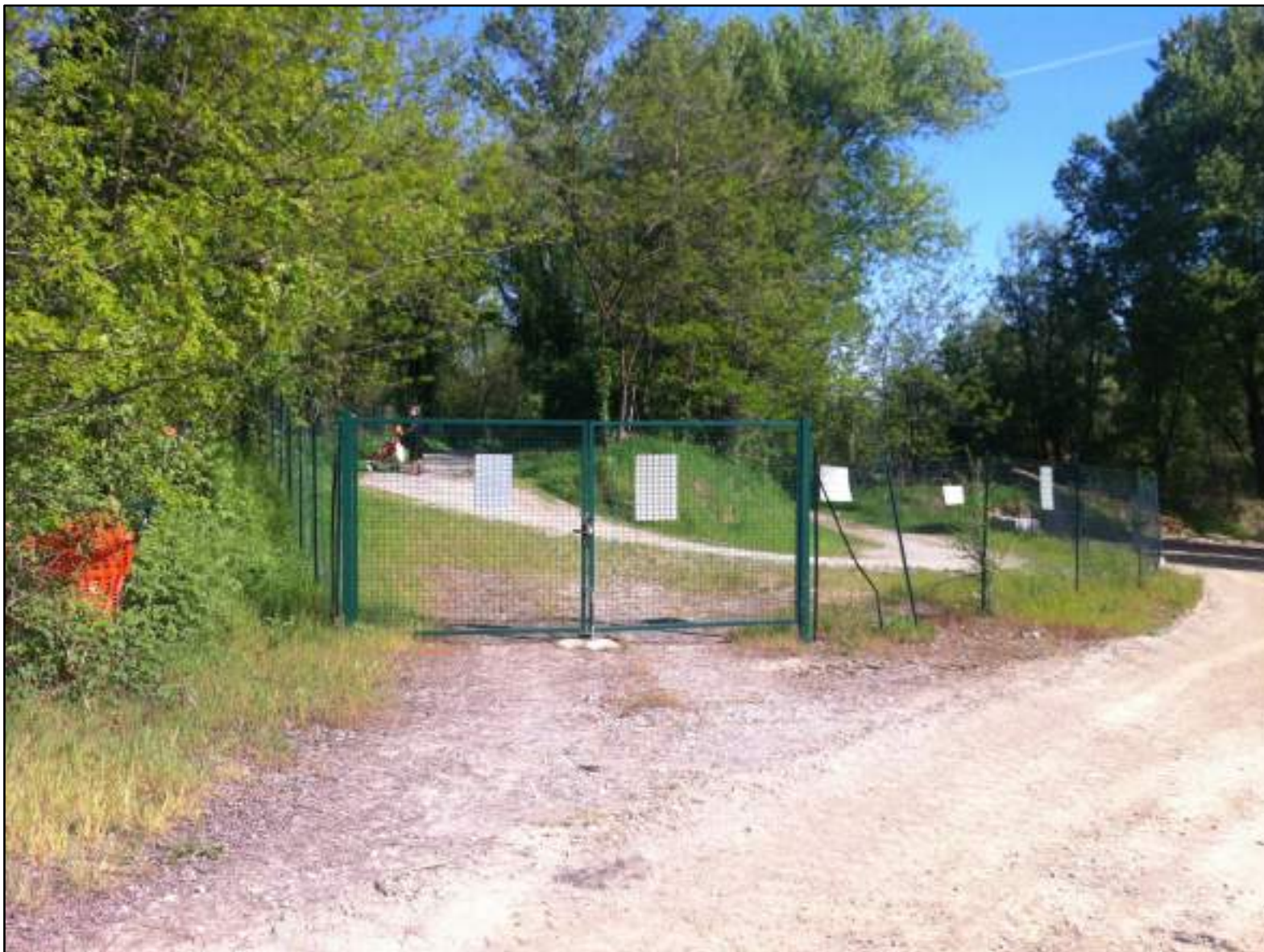
FOTO 34 - VISTA DELL'AREA A NORD-EST, PERCORSI PEDONALI