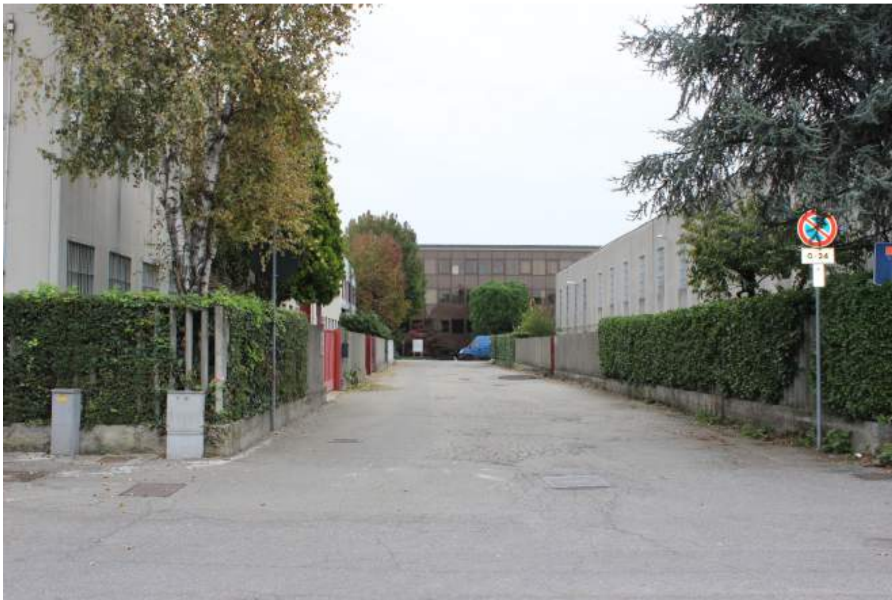
FOTO 9 – VISTA DA VIA LEONARDO VERSO IL COMPLESSO INDUSTRIALE A EST