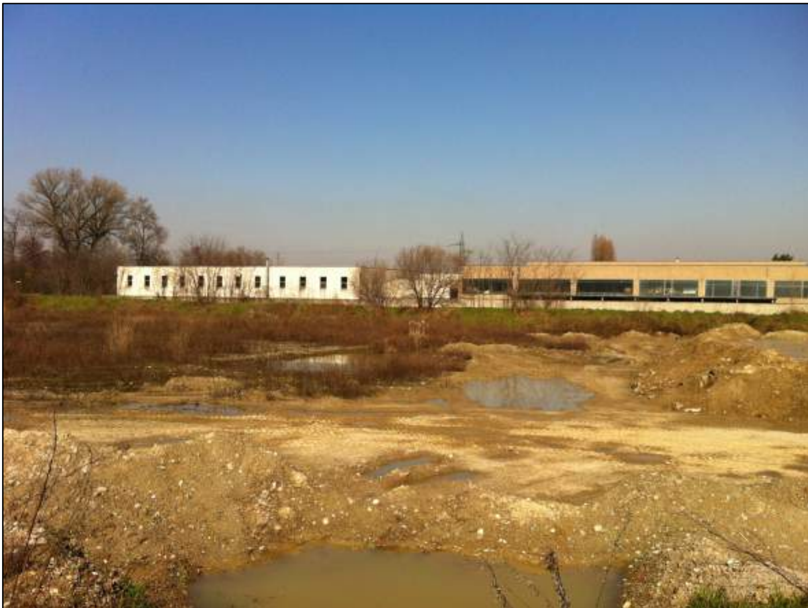
FOTO 24 - VEDUTA DALL'AREA D'INTERVENTO VERSO NORD: AREA INDUSTRIALE A CONFINE