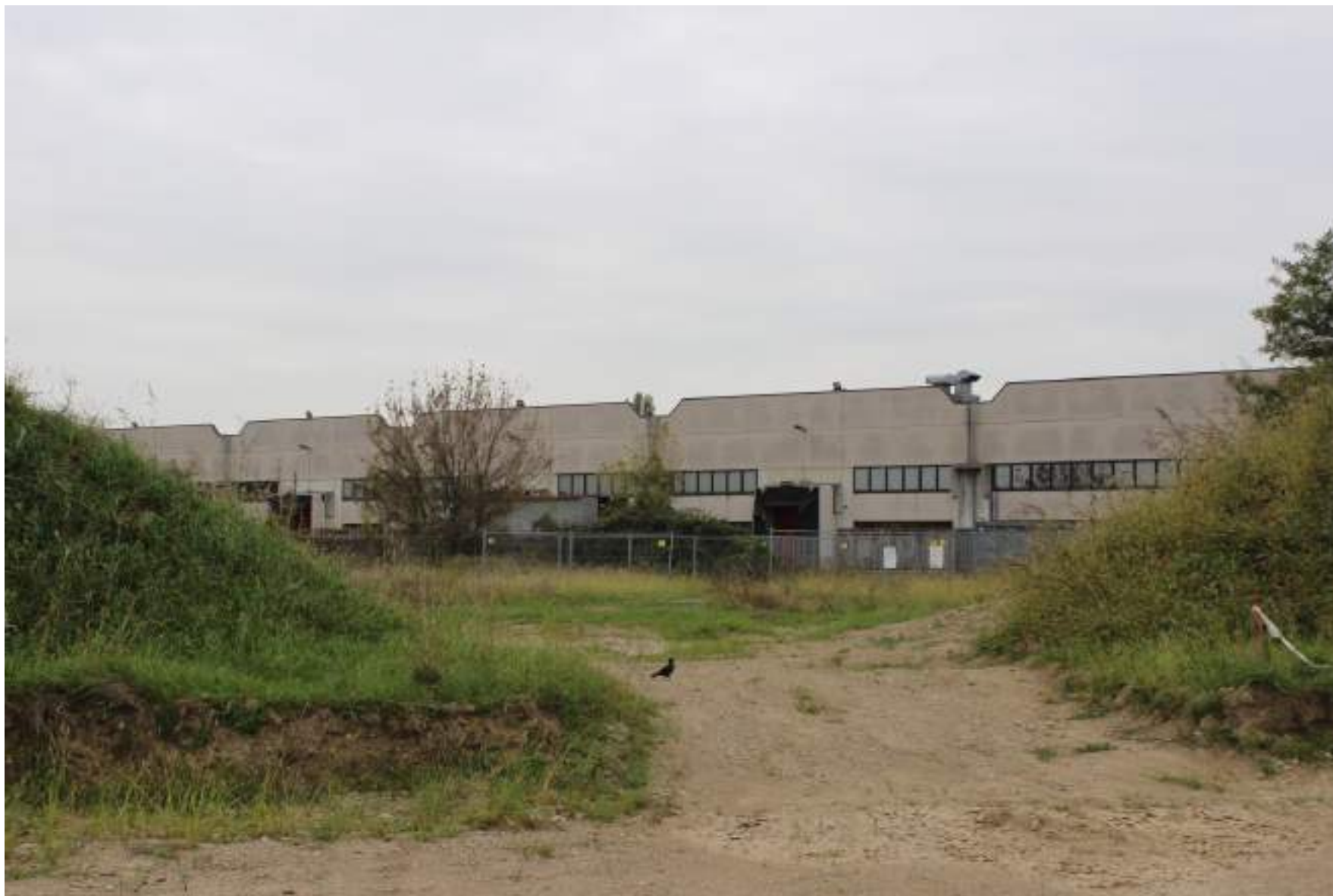
FOTO 48 - VISTA DALLA RIVA DEL BACINO D'ACQUA DELLA CAVA VERSO SUD OVEST