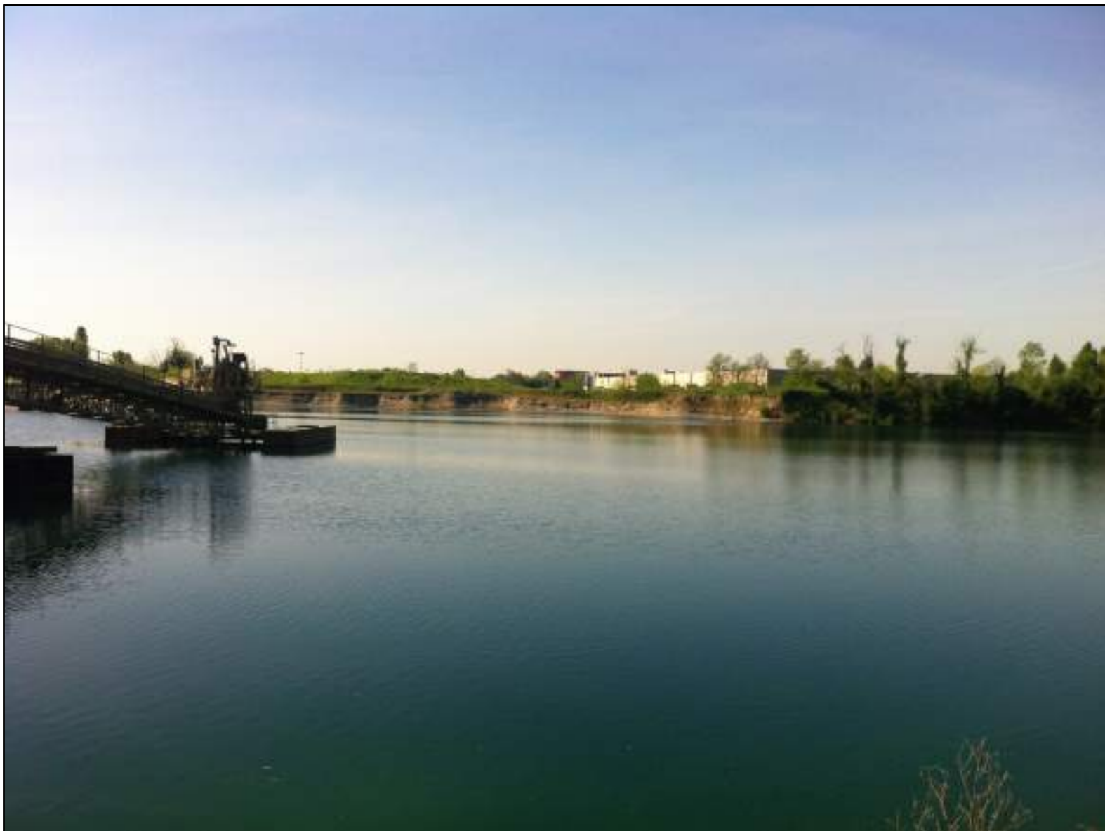
FOTO 32 - VISTA DELLA SPONDA DEL BACINO DI CAVA, VERSO L'AREA D'INTERVENTO A SUD