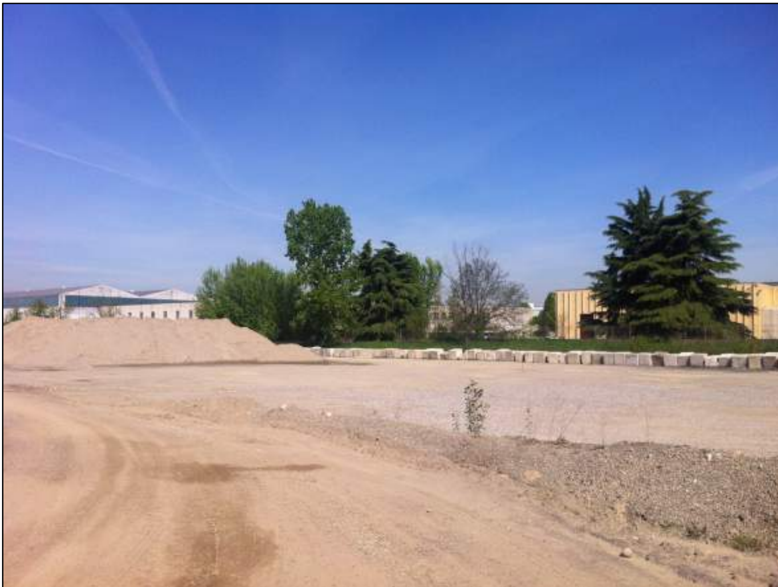
FOTO 17 - VEDUTA VERSO NORD DELL'AREA INDUSTRIALE DALL'AREA D'INTERVENTO