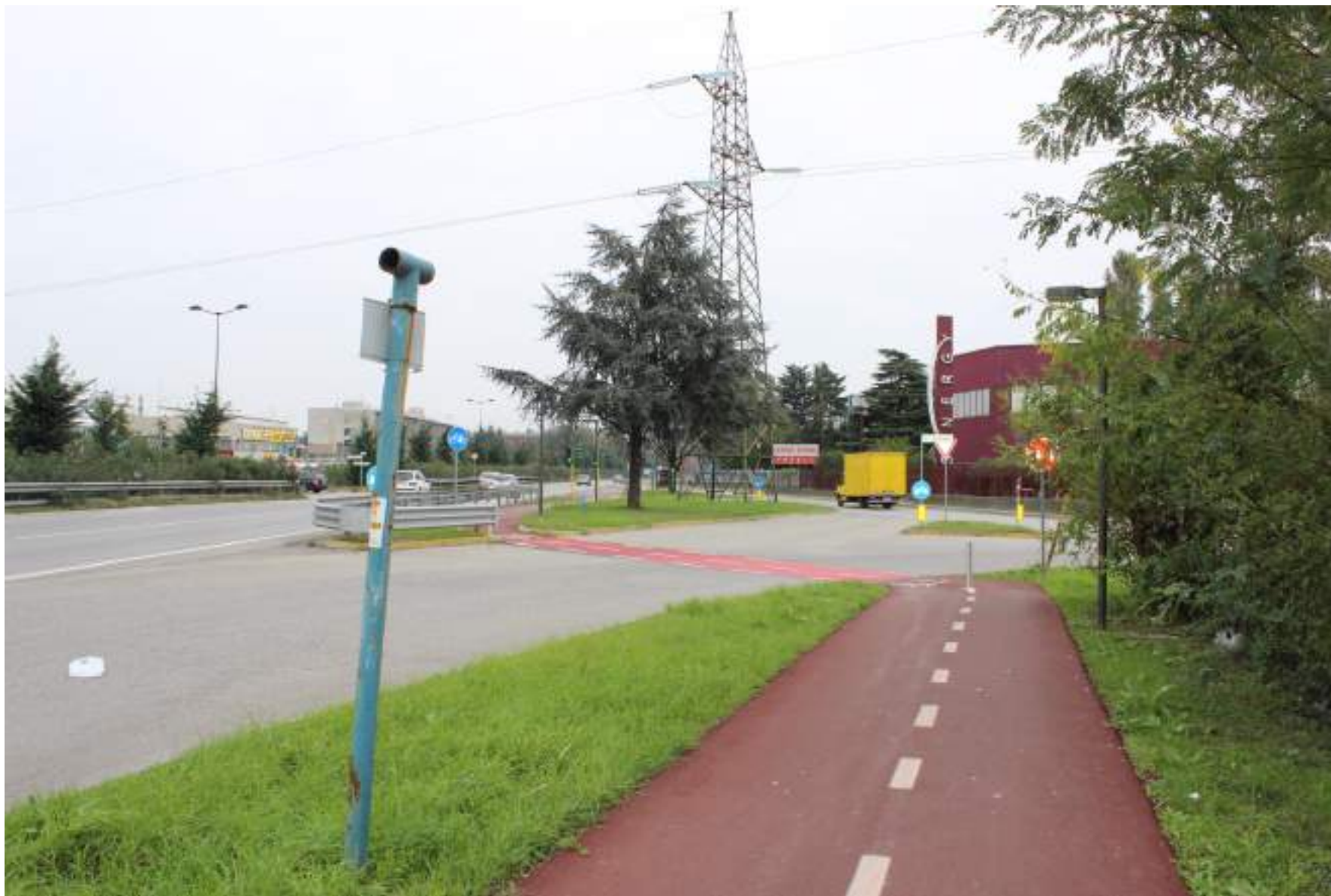
FOTO 1 - VISTA DALLA VIA CASSANESE VERSO L'INGRESSO ALLA VIA CAVA TROMBETTA