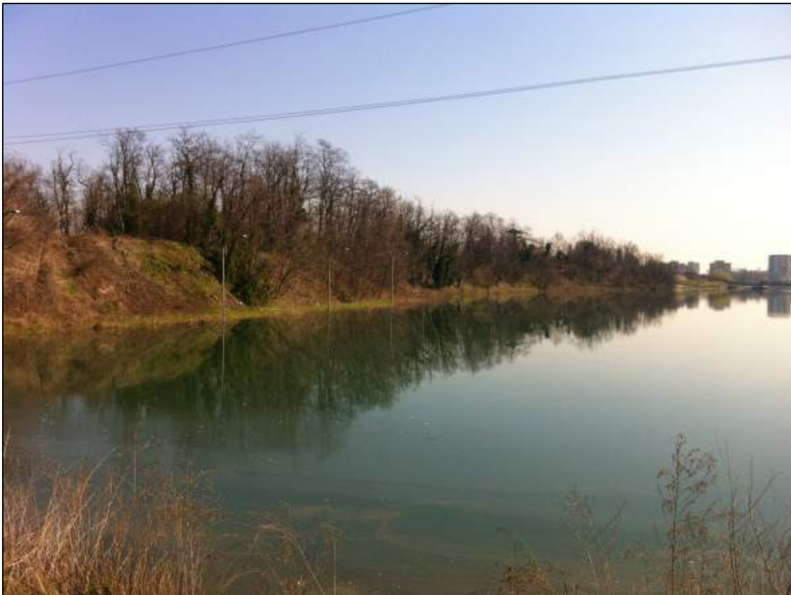
FOTO 50 - SPONDA NORD DEL BACINO DI CAVA, VISTA DA OVEST