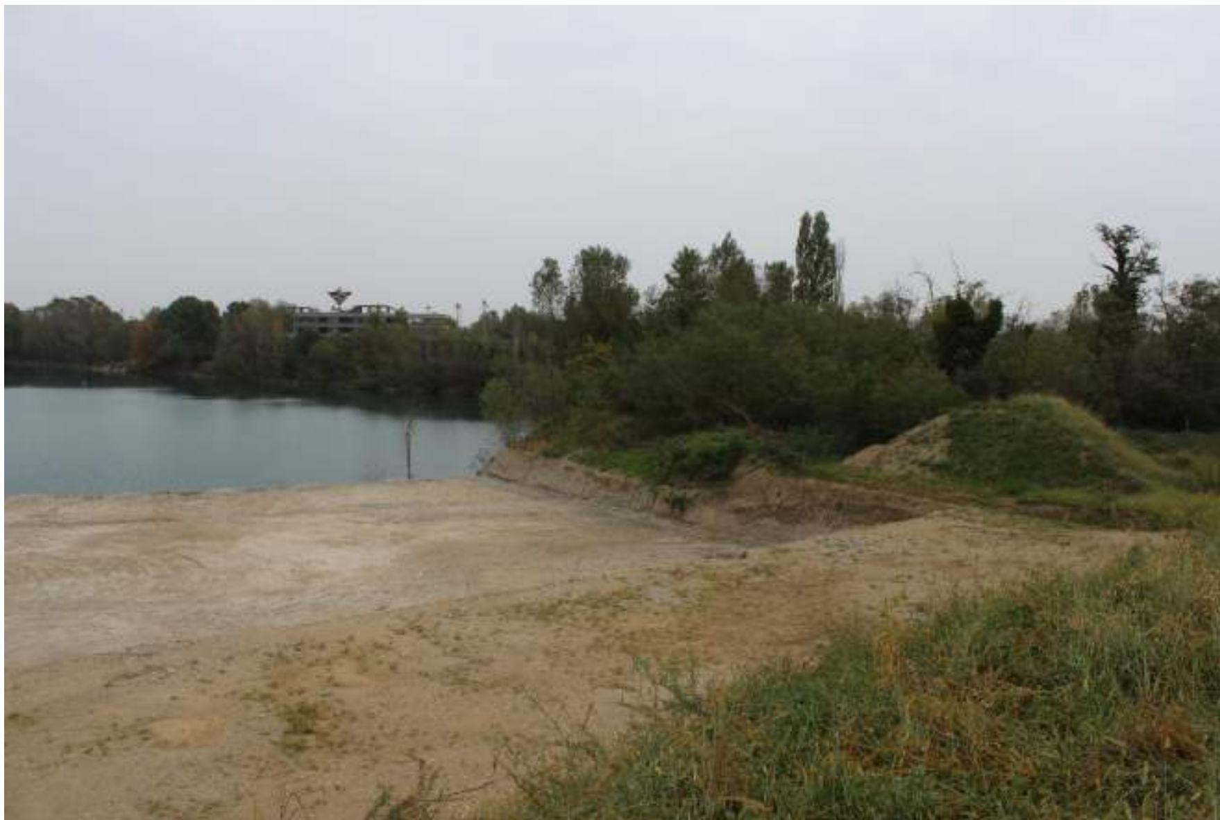
FOTO 46 - VISTA DALLA RIVA DEL BACINO D'ACQUA DELLA CAVA VERSO EST