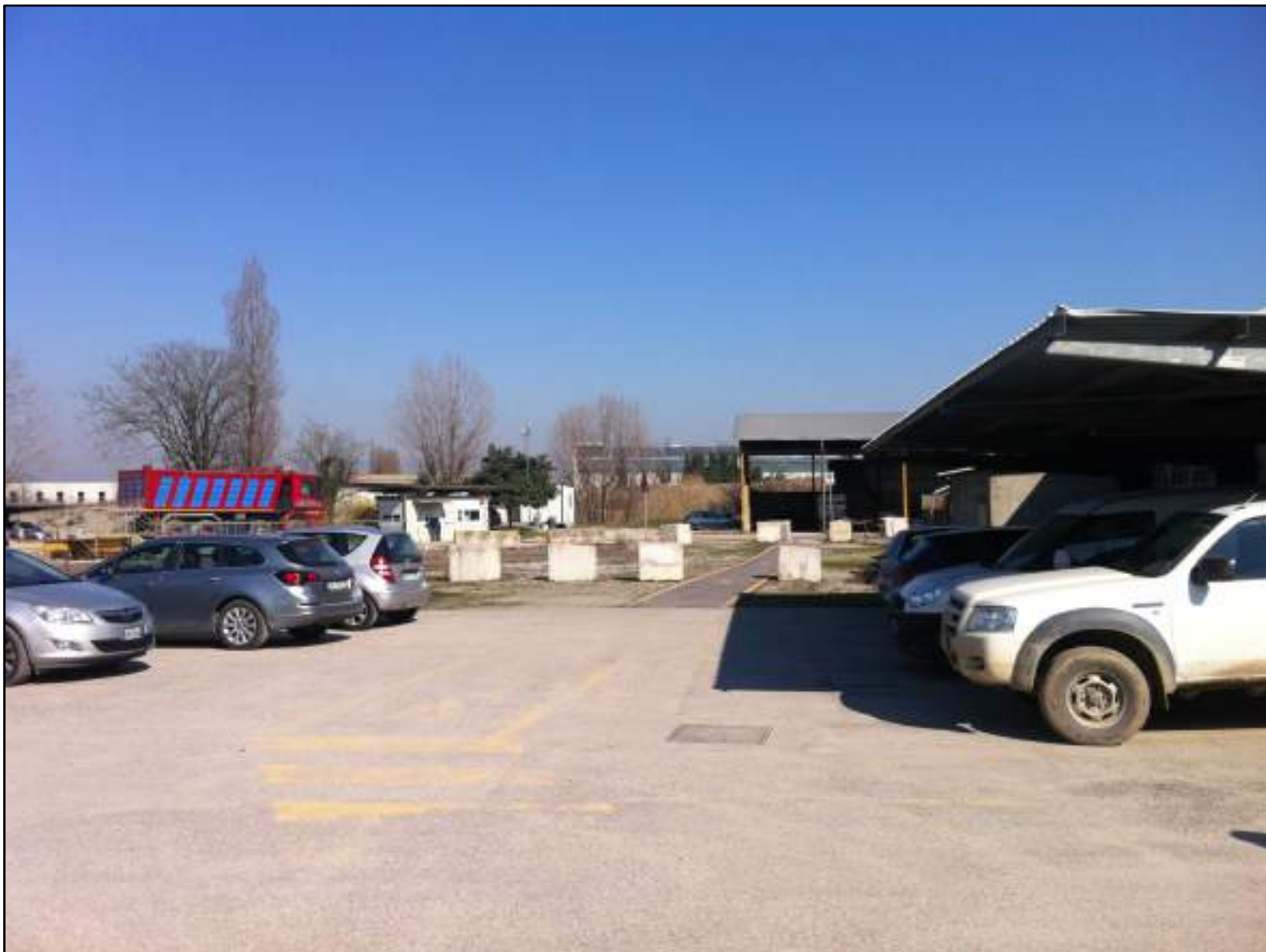
FOTO 26 - VEDUTA DELL'ATTUALE IMPIANTO PRODUTTIVO, VERSO NORD