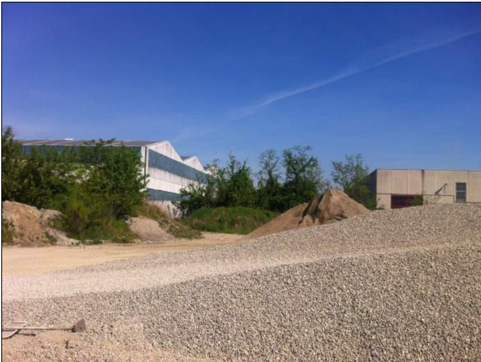
FOTO 15 – VEDUTA DEL FRONTE INDUSTRIALE VERSO VIA LEONARDO DA VINCI