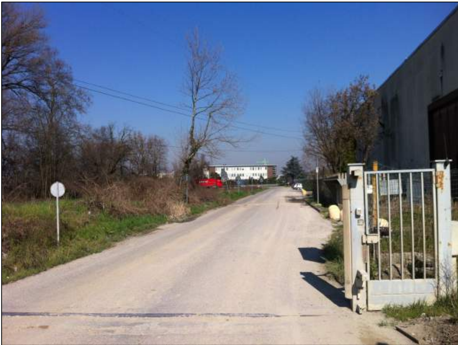
FOTO 11 - VISTA VERSO LA VIA CAVA TROMBETTA E VIA CASSANESE