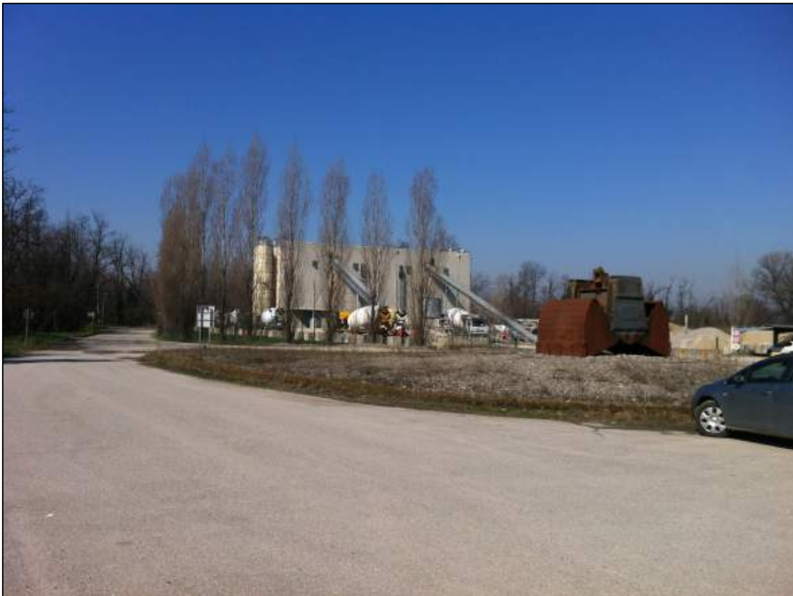
FOTO 27 - VEDUTA DELL'ATTUALE IMPIANTO PRODUTTIVO, VERSO EST