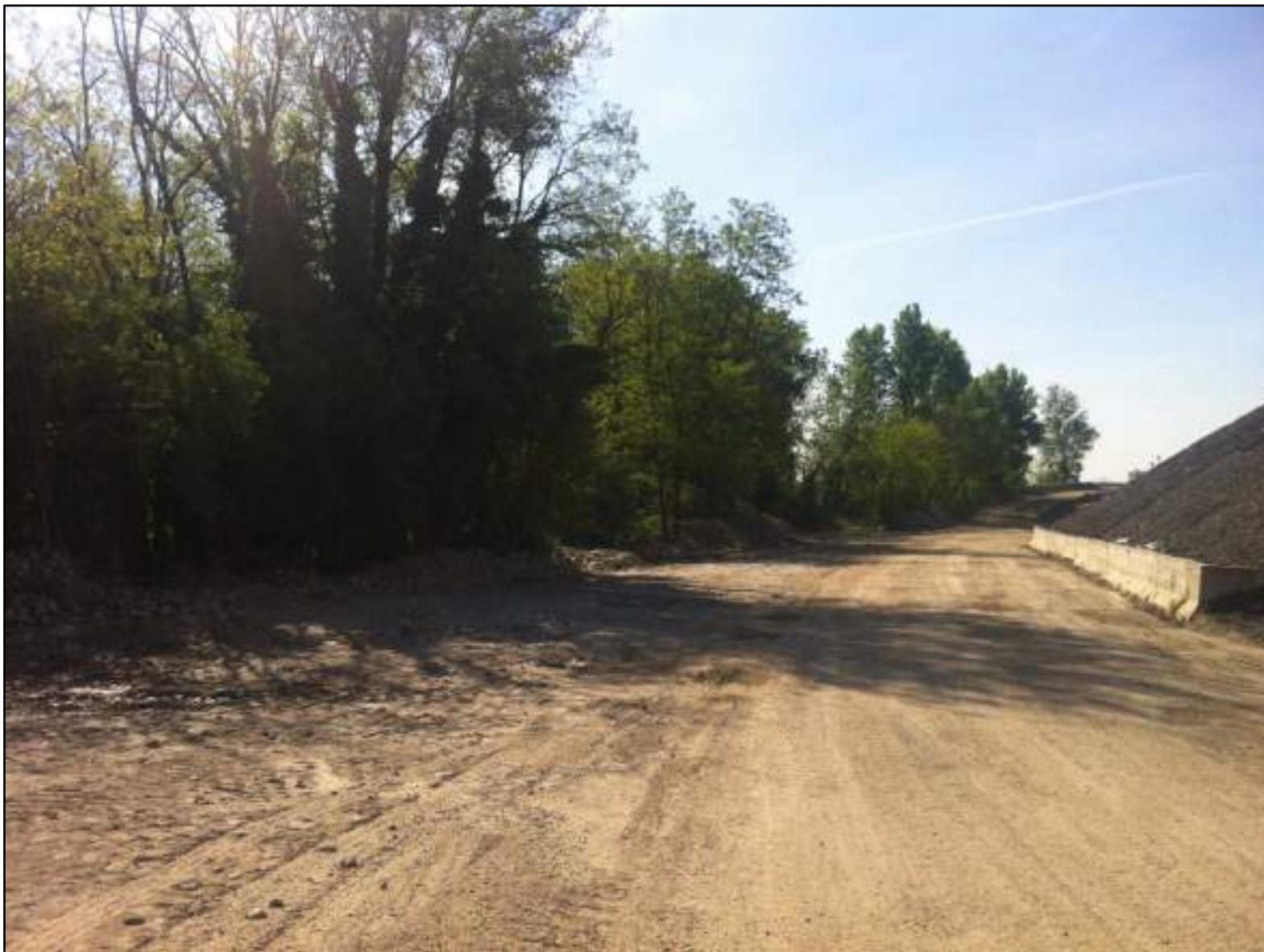
FOTO 20 - VEDUTA VERSO SUD – AREA BOSCATO LUNGO IL CONFINE DI PROPRIETA'