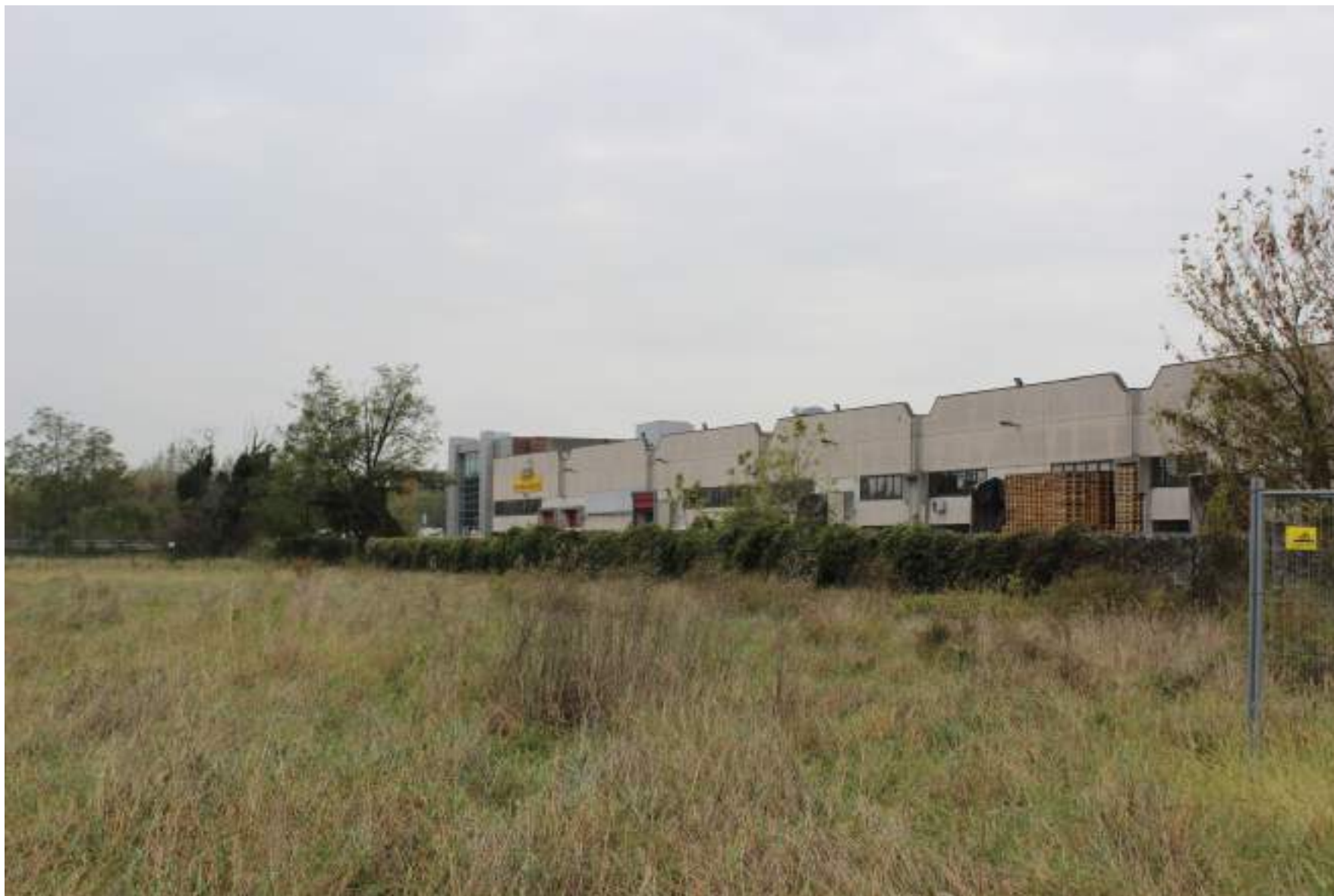
FOTO 43 - VISTA DALLA RIVA DEL BACINO D'ACQUA DELLA CAVA VERSO IL COMPLESSO INDUSTRIALE IN VIA VENEZIA GIULIA A SUD OVEST