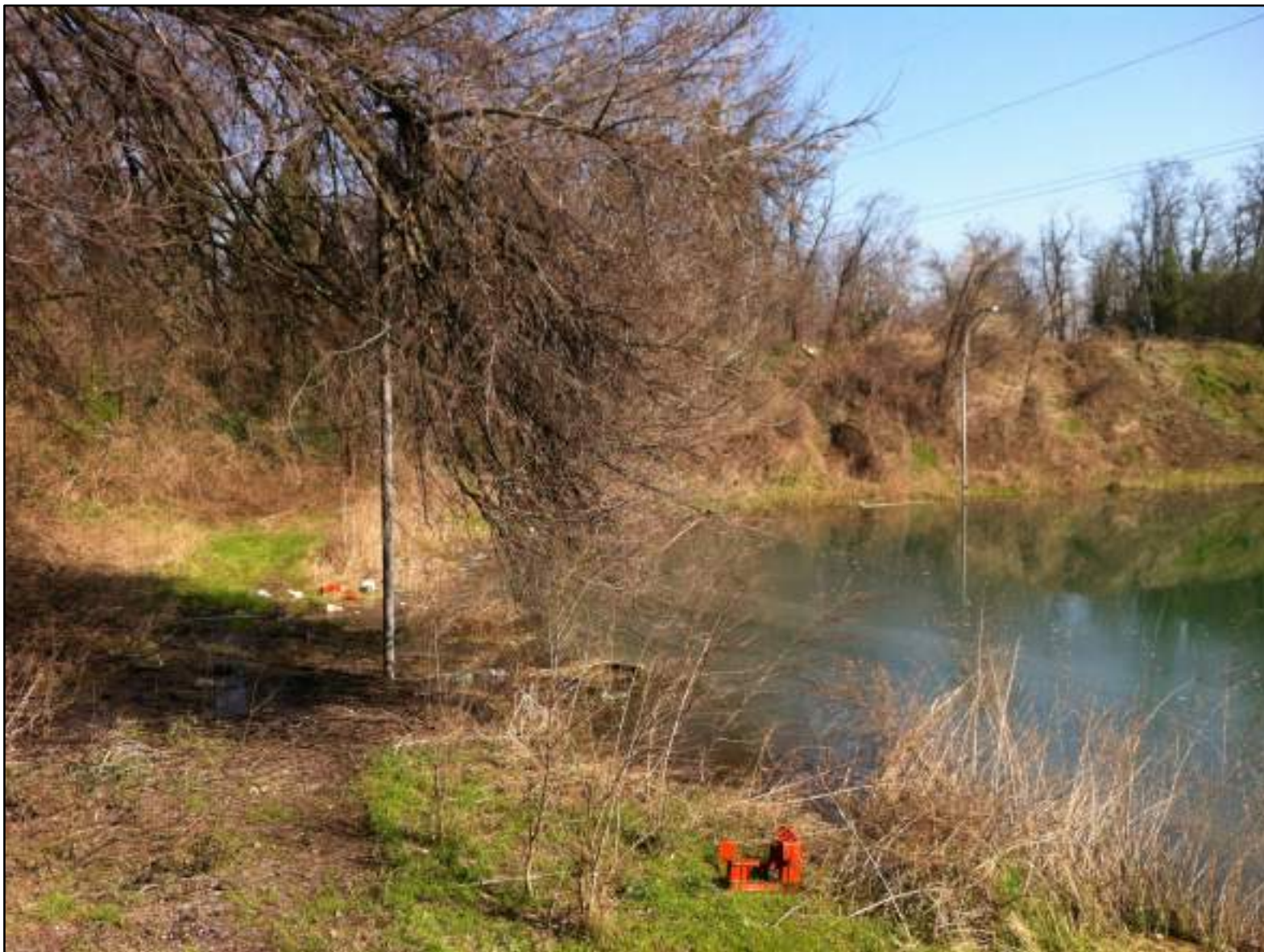
FOTO 51 - VISTA DELLA SPONDA DEL BACINO DI CAVA DA OVEST