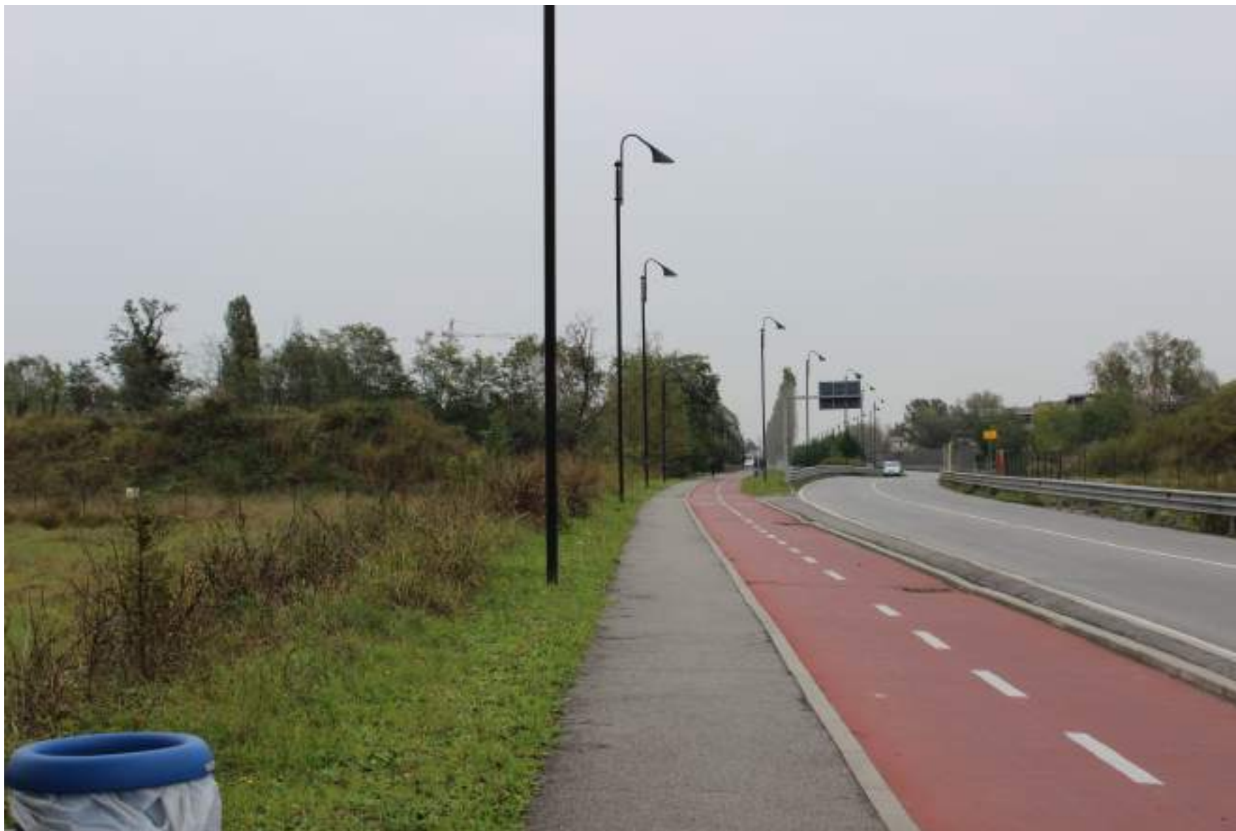
FOTO 37 - VISTA DI VIA REDECESIO VERSO ES