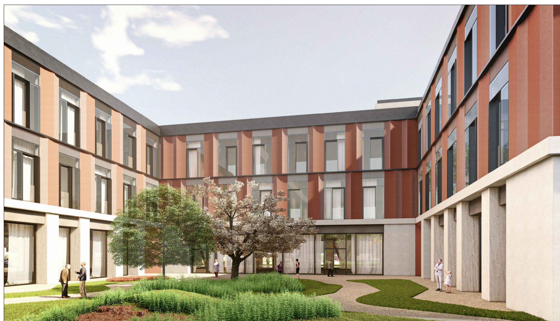
V5 - Stato di progetto

Progettisti: Masterplanstudio arch. Stefano Gaudimundo arch. Simone Lasala