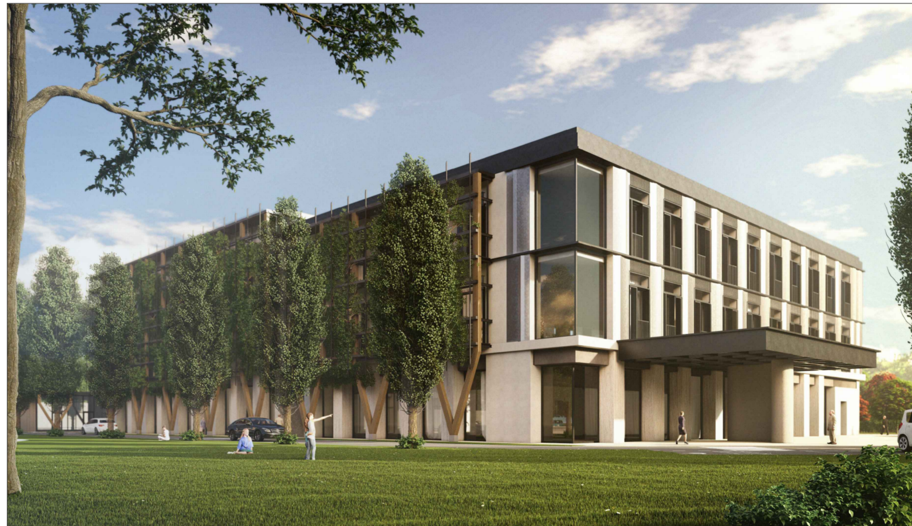
V4 - Stato di progetto