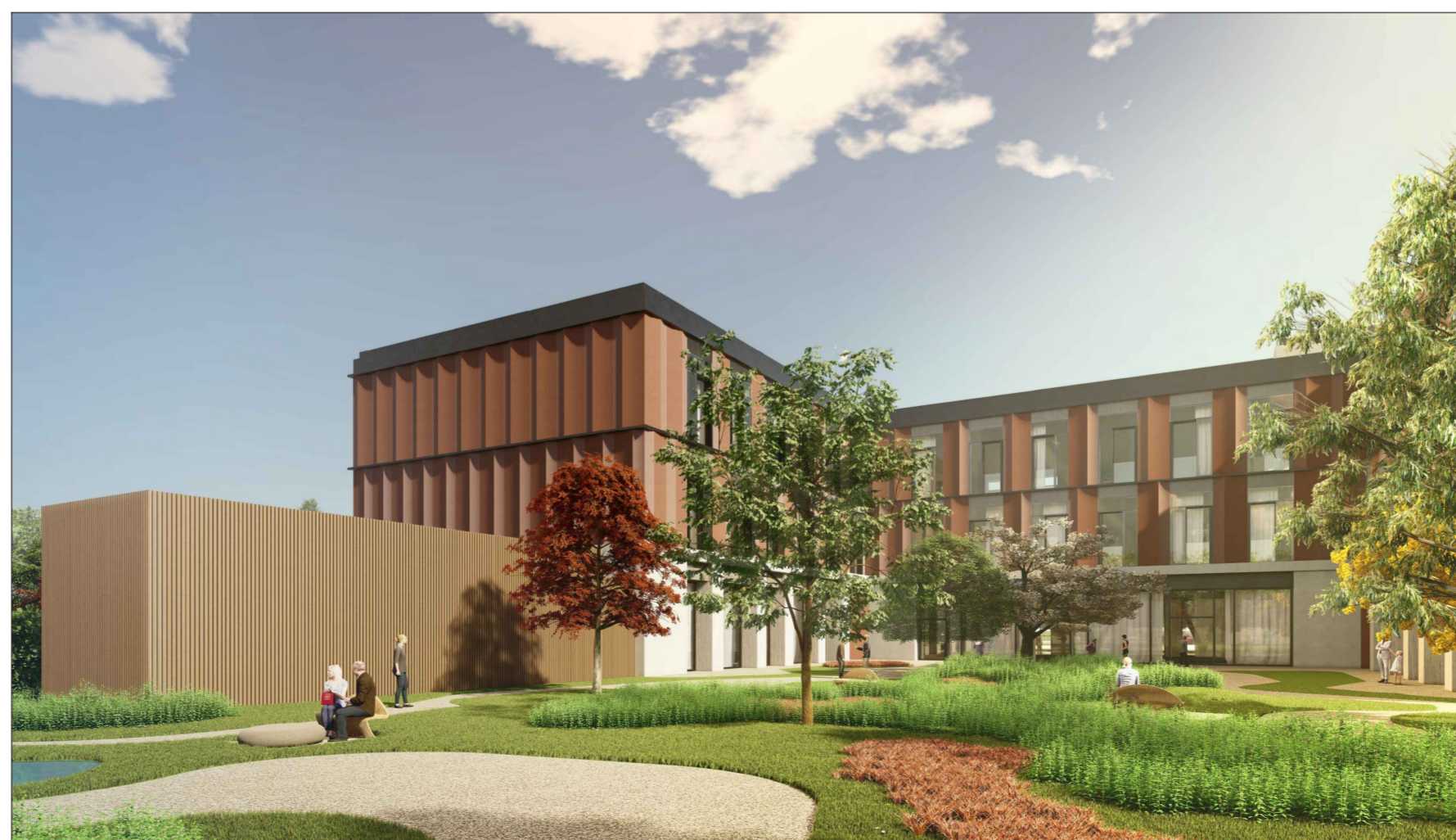
V6 - Stato di progetto

File rif.: T.07a-b_Simulazione tridimensionale.dwg