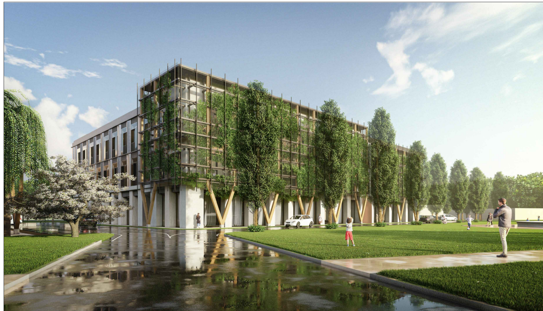
V3 - Stato di progetto