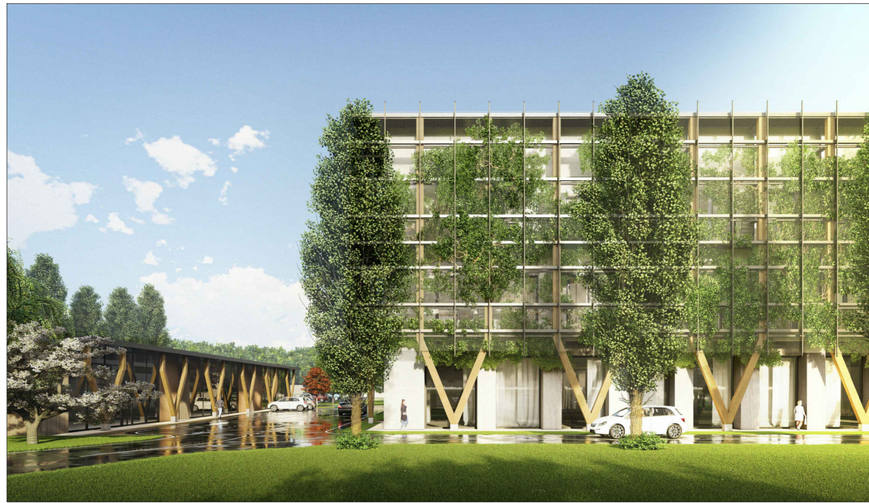
V2 - Stato di progetto