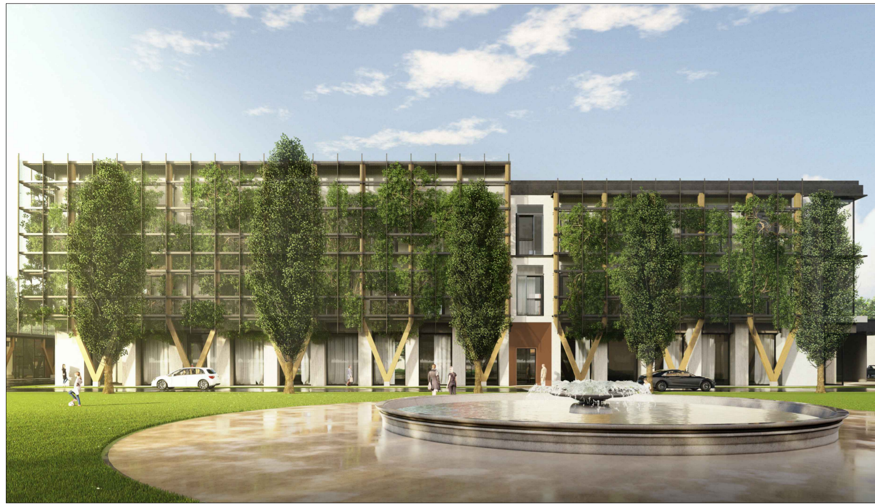
V1 - Stato di progetto