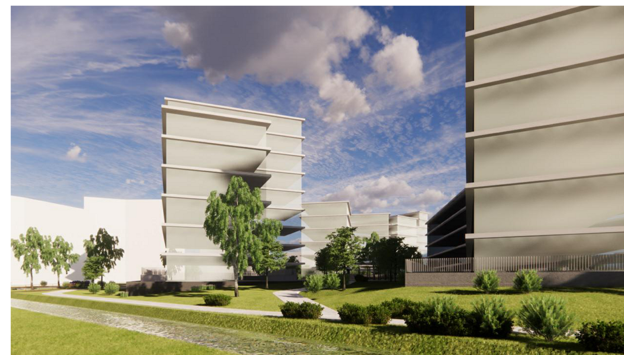
5. VISTA PARCO SUD