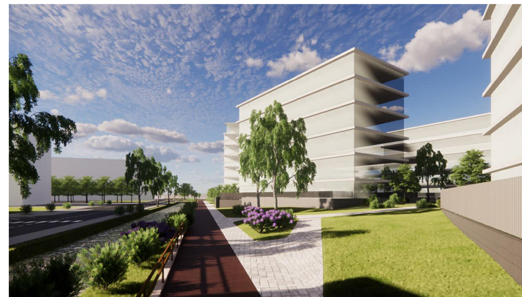
3. VISTA PARCO OVEST