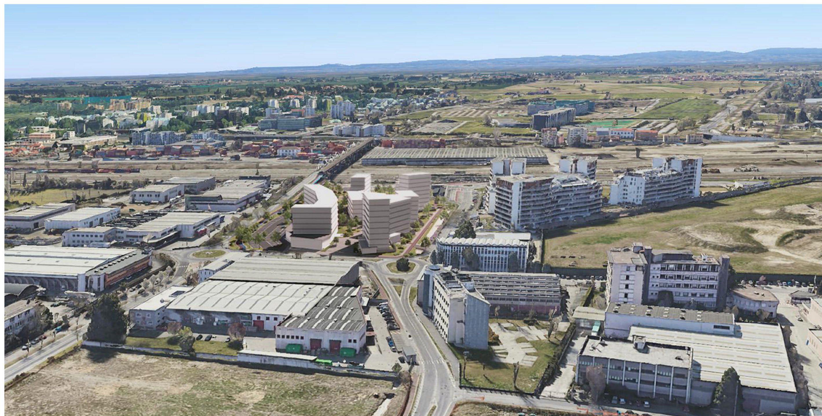
1. VISTA AEREA - NORD