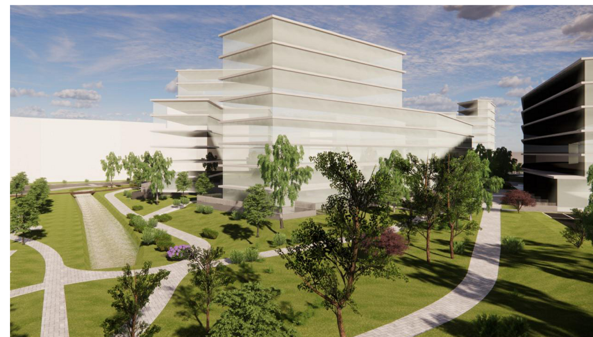
4. VISTA PARCO SUD-EST