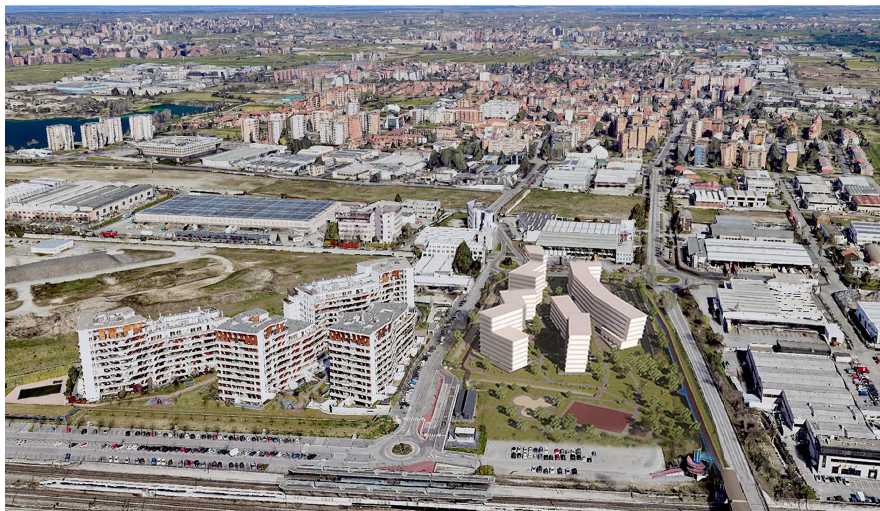
2. VISTA AEREA - SUD